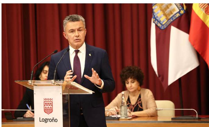
■ El alcalde avanzó sus propuestas para la ciudad.