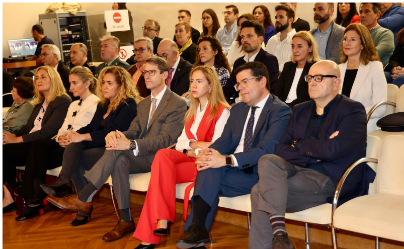
■ El Debate del Estado de la Ciudad contó con la presencia de un público abundante, así como de autoridades de instituciones locales, autonómicas y del estado.

La inversión de más de 5 millones en las infraestructuras deportivas gracias al acuerdo con el Gobierno de La Rioja, el desarrollo de Ebro Vivo, una iniciativa para que el río sea un espacio de promoción de la actividad física, cultural y medioambiental, la convocatoria de una segunda plaza de agente de igualdad en el Ayuntamiento, o la puesta en marcha de un proyecto de vivienda compartida para personas mayores solas o son otras de las actuaciones que avanzó el alcalde.