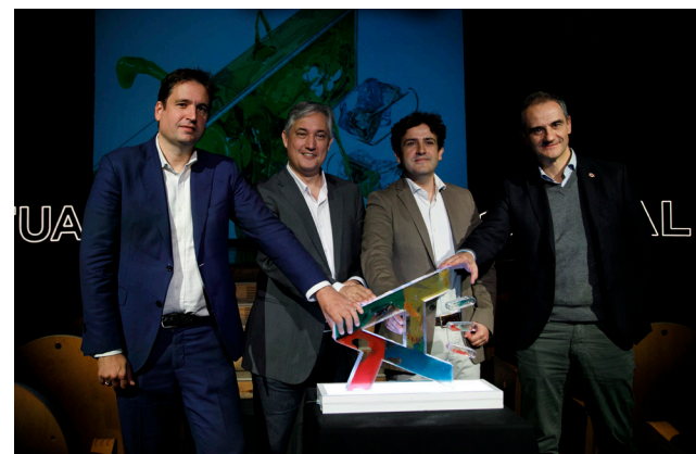
Presentación de la nueva edición del Actual.

Por último, las artes tendrán también una presencia especial con Escenario Insólito y Sala Negra en la parte teatral, junto a una