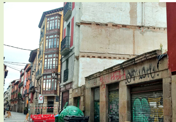
Parcela de Marqués de San Nicolás.

Además, de los 13 inmuebles que se incluyeron en la segunda fase del Plan, propiedades en el Centro Histórico, se han recibido ofertas en 9 casos por lo que, de