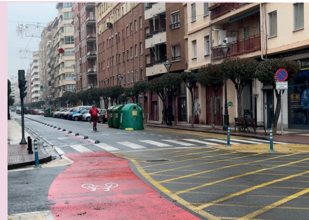
■ Calle Duquesa de la Victoria que se volverá a licitar en breve.

La adecuación de esta vía permitirá consolidar el eje ciclista este-oeste, devolver la continuidad lineal al carril de circulación de vehículos, la dotación de aparcamientos y mejoras en el alumbrado, la red de abastecimiento y en pavimentación.