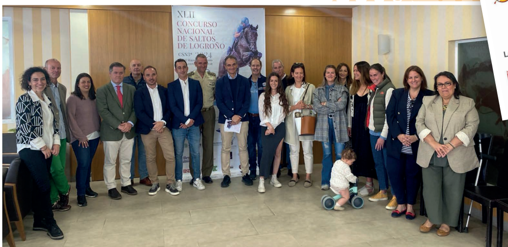
■ Presentación del XLII Concurso Nacional de saltos de Caballo que se celebra este fin de semana en Logroño.