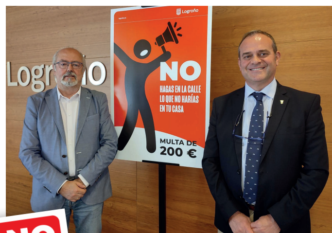
■ Los concejales de Medio Ambiente e Interior presentaron la campaña.

En este sentido, a través del Cuerpo de Policía Local, desde el mes de enero hasta el pasado fin de semana, se interpusieron cerca de 800 denuncias por violación de las ordenanzas municipales de Fomento de la Convivencia Ciudadana, Limpieza, Ruidos y Tenencia y Protección de Animales.