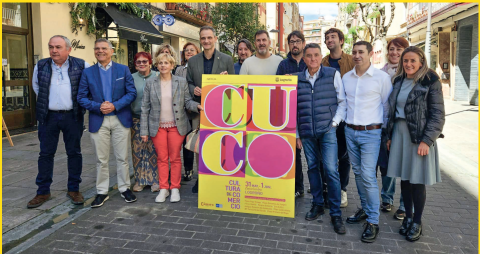
■ Ayuntamiento, Cámara de Comercio y comerciantes presentaron la iniciativa.

• Sorteo de un crucero por parte de los comerciantes "Zona Centro". Parque Gallarza.