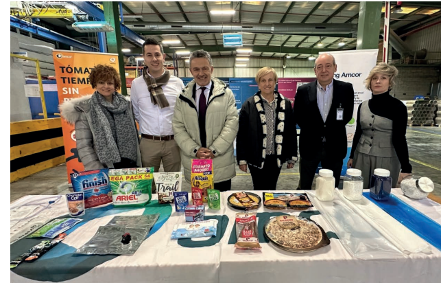
■ El alcalde visitó recientemente la empresa.

AMCOR es una empresa líder mundial en el sector del envasado flexible destinado a la industria alimentaria, farmacéutica y médica, entre otros sectores. La compañía,