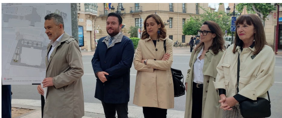
El alcalde, el concejal de Patrimonio, técnicos municipales y la directora de IES Sagasta en la presentación del proyecto.

Para la conexión peatonal de la Glorieta con Avenida de la Paz (C) se plantea la sobreelevación de los pasos de peatones existentes en la confluencia de Avenida de la Paz con Juan XXIII y el paso de peatones de Avenida de la Paz que cruza a la ESDIR, en un área que afectaría a unos 400 metros cuadrados y la eliminación de la jardinera de remate para facilitar la accesibilidad y la conexión visual de los espacios del entorno.