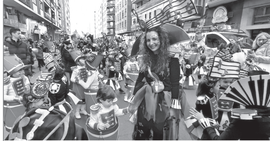
■ Comparsa ganadora en el Carnaval de 2023.