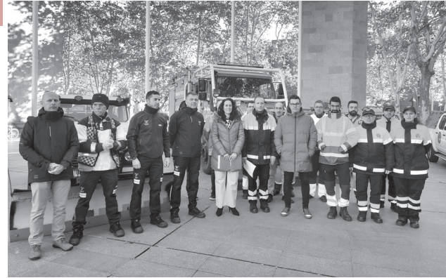
■ Presentación del dispositivo de emergencia invernal.

A este inventario hay que añadir 20 carros manuales de la UTE Logroño Limpio, esparcadores de sal. Estos equipos realizan los tratamientos preventivos en pasarelas, pasos de peatones, aceras y puntos críticos independientemente de que el plan esté activo o no. Asimismo, para situaciones críticas, está a