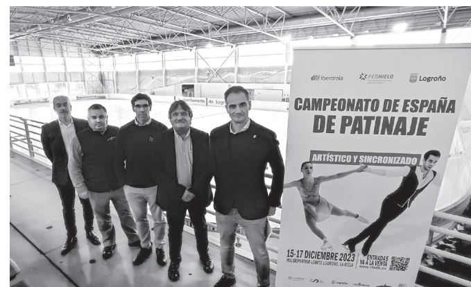
■ Presentación del campeonato absoluto de patinaje artístico y sincronizado en la pista de hielo de Lobete.

Las entradas están ya a la venta en ticketing: www.rfedh.es .