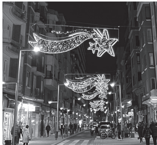
■ Iluminación navideña en 2022 y caja regalo instalada este año en las Cien Tiendas.

Además, hay que destacar algunos elementos singulares de la decoración navideña en Logroño: una gran caja de regalo, cuyo interior puede atravesarse, se ubicará en la confluencia de Juan XXIII con Presidente Calvo Sotelo. Cuenta con 4 metros de alto y 3,80 de ancho. Frente a la entrada de la antigua estación de autobuses se podrá disfrutar de un abeto de 12 metros