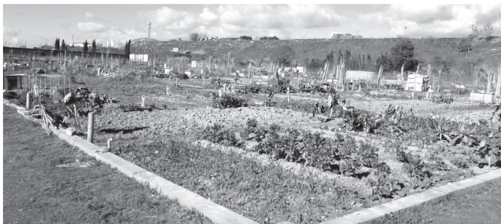
■ Huertos de ocio en Logroño.

Se deberá presentar el modelo de solicitud debidamente cumplimentada, que estará disponible en el Servicio de Atención e Información 010 del Ayuntamiento de Logroño, así como en la web municipal, ante el Registro General del Ayuntamiento. También puede hacerse en cualquiera de las formas autorizadas por el artículo 16 de la Ley 39/2015, de 1 de octubre, del Procedimiento Administrativo Común de las Administraciones Públicas. En la solicitud, los interesados deberán manifestar, mediante declaración