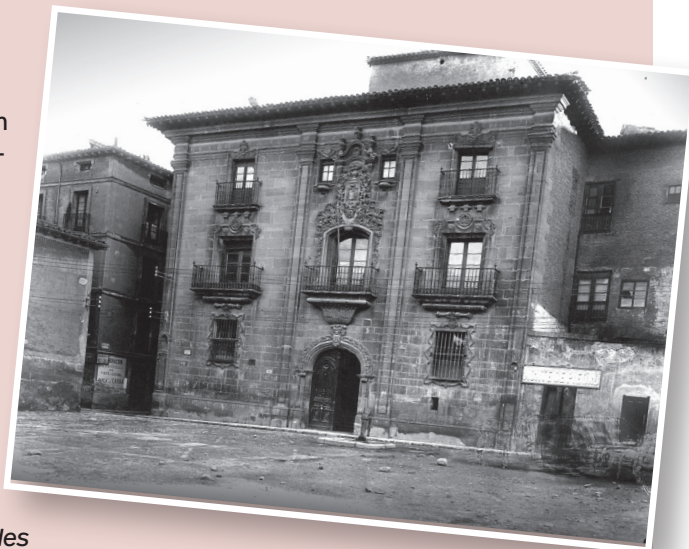
■ Casa de Pedro Eloy de la Porta.

Pedro Eloy de la Porta compró años más tarde uno de los Regimientos Perpetuos de esta ciudad (el de Felipe de la Vid) y adquirió fincas rústicas y urbanas, estableciendo un mayorazgo en los años 60 del siglo XVIII cuyo epicentro era una casa en la plaza de San Agustín, construi-