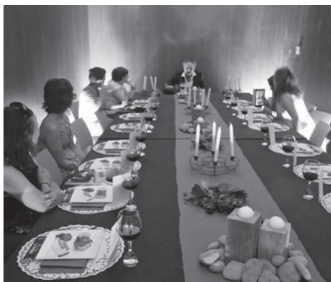
Una cata teatralizada, en el Centro de la Cultura del Rioja

Por su parte, Gonzalo Capellán destacó que “la apuesta del Gobierno de La Rioja y del Ayuntamiento de Logroño por consolidar nuestra tierra como modelo de turismo gastronómico ha sido un éxito del que se han beneficiado el sector turístico y los productos agroalimentarios de nuestra tierra”.