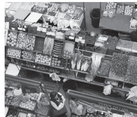
El Mercado de Abastos muestra nuestros productos