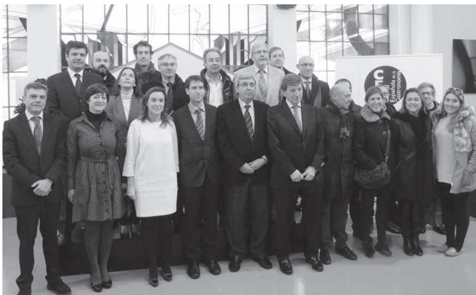
Momentos después de hacer balance, se unieron representantes de las instituciones, organizadores y sector privado que han contribuido al éxito de la candidatura de Logroño-La Rioja como Capital Española de la Gastronomía

Los dos organismos responsables del título de la Capitalidad Gastronómica -FEHR y FEPET- valoraron “muy positivamente” la experiencia de Logroño-La Rioja y aseguraron que ha supuesto un retorno económico estimado en 4.280.978 euros para la región. Además, destacaron la importante presencia que Logroño-La Rioja ha tenido en los medios de comunicación, con más de 1.950 referencias periodísticas tanto en medios escritos como on line.