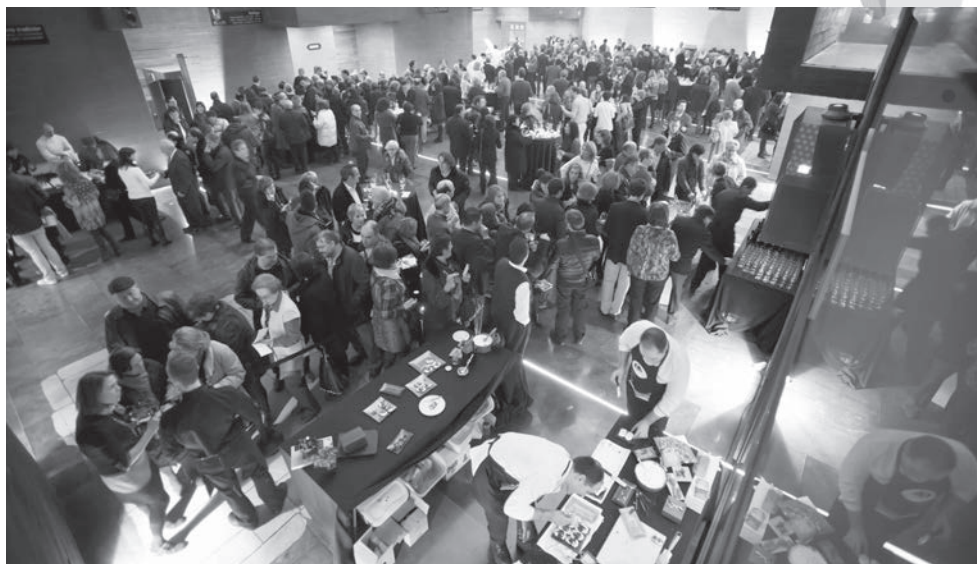
El Centro de la Cultura del Rioja acogió también la cena que supuso el cierre de las actividades de la Capitalidad