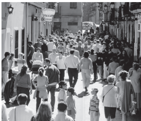
La calle Laurel, uno de los símbolos de la ciudad.

Gamarra aseguró que estos resultados no hubieran sido posibles sin el esfuerzo de las administraciones y de todos los agentes implicados en la promoción de la marca Logroño-La Rioja en todo el mundo, a través de campañas de comunicación, par-