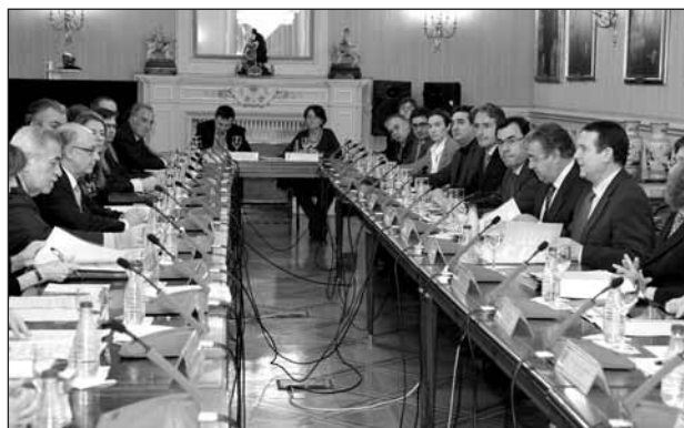
La alcaldesa de Logroño, Cuca Gamarra, participó la semana pasada en el Pleno de la Comisión Nacional de Administración Local, que estuvo presidida por el ministro de Hacienda, Cristóbal Montoro. Gamarra, tras la reunión, afirmó "el respeto con que, por primera vez, nos han tratado a los ayuntamientos" .

Además de estos principios, el proyecto incluye medidas más concretas, dirigidas a la reactivación económica. En este sentido, la alcaldesa afirmó