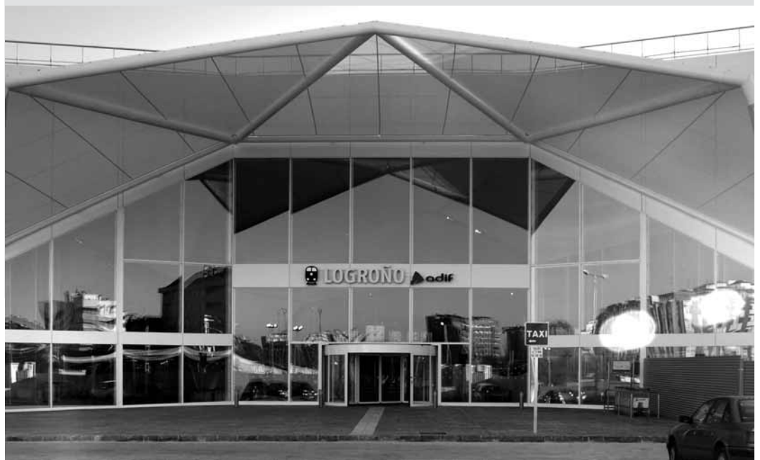
Fachada principal de la nueva estación de tren de Logroño

Por último, se acordó pedir a Adif "que agilice las tareas de desafectación de los terrenos liberados por las obras para ponerlos a disposición de la Sociedad del Ferrocarril y que ésta pueda disponer de ellos a finales de año". El dinero resultante de las enajenaciones irá a amortizar el préstamo solicitado para financiar la primera fase, en la parte correspondiente a las participaciones de la Sociedad (25%, Ayuntamiento y Gobierno regional y 50%, Ministerio).