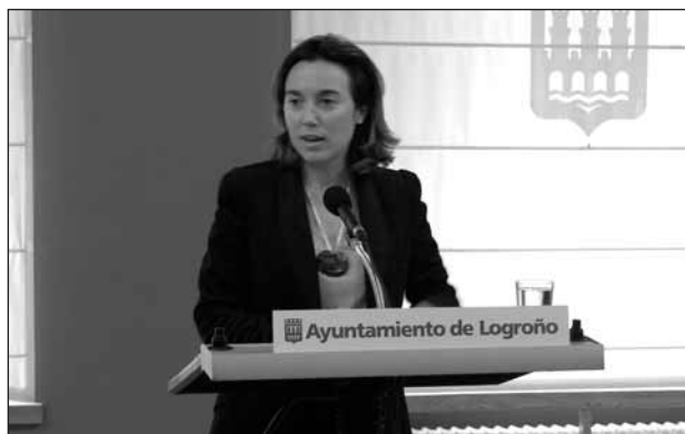
La alcaldesa de Logroño explicó en rueda de prensa las medidas aplicadas por el Ayuntamiento dentro de su compromiso de alcanzar la estabilidad presupuestaria.

Otra línea trazada en el proyecto -la eliminación de organismos autónomos- ya se concretó en Logroño con la liquidación de la Fundación Logroño Turismo. Como recordó Gamarra, la disolución de esta entidad se produjo por la política de ahorro impuesta en el Ayuntamiento y para evitar duplicidades.