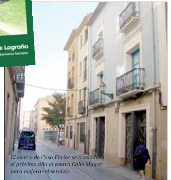
El centro de Casa Farias se trasladará el próximo año al centro Calle Mayor para mejorar el servicio

En el servicio de comidas a domicilio se han esta-