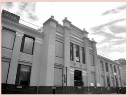
Biblioteca Rafael Azcona