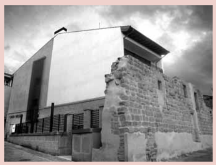
Museo de la ciudad

• Equipamiento del futuro museo de la ciudad ..... 200.000 • Equipamiento del Centro de Cultura Popular ..... 100.000