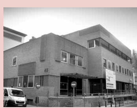
Centro de la Cultura Popular

REFORMAS EN LA CASA CONSISTORIAL ..... 360.000