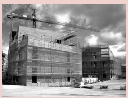
Centro cívico de Yagüe

PATRIMONIO MUNICIPAL DE SUELO • PERI Carrocerías Ugarte ..... 1.400.000 • Aportación al sector Las Cañas ..... 1.285.000 • Urbanización de Calleja Vieja ..... 603.000 • PERI Ferrocarril ..... 500.000 • Aportación al sector Valparaíso ..... 500.000 • Subvenciones a jóvenes para la construcción de viviendas ..... 300.000