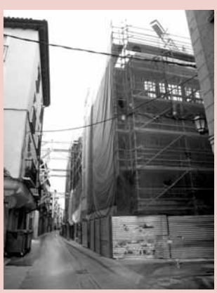
Centro de la Cultura del Rioja