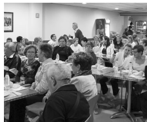
Talleres de Vida Sana.

Este taller se desarrollará los martes y jueves, de 16:00 a 17:30 horas, del 5 al 28 de noviembre en el Centro de Servicios Sociales de Acesur. Las inscripciones se pueden realizar en el Servicio 010 hasta el 4 de noviembre.