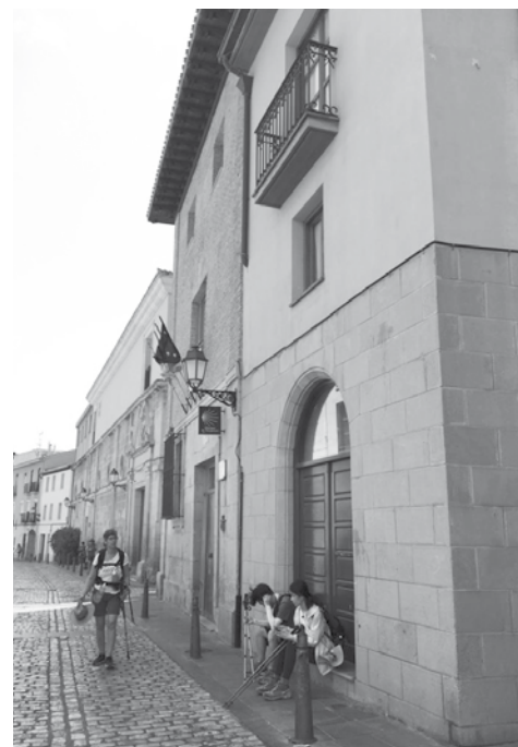
Peregrinos a su paso por Logroño.

Estas obras, que cuentan con un presupuesto de 634.837,73 euros, se llevarán a cabo gracias a la revisión y reactivación del proyecto presentado por la Corporación anterior al programa de subvenciones conocido como '1,5% Cultural', que destina el Ministerio de Fomento para financiar trabajos de conservación o enriquecimiento de bienes inmuebles del patrimonio histórico nacional y que permite que, en concurrencia competitiva, instituciones como el Ayuntamiento de Logroño puedan obtener cofinanciación para abordar