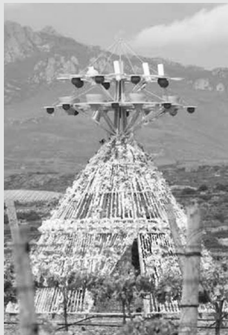
Actuación en Bodegas LAN.