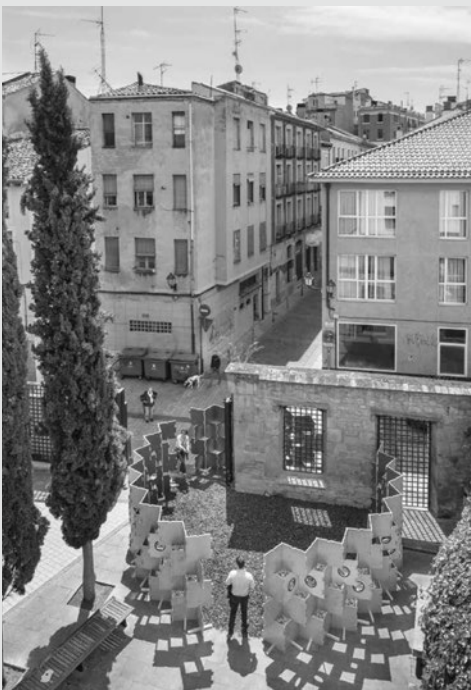
Intervención en el Albergue de Peregrinos.