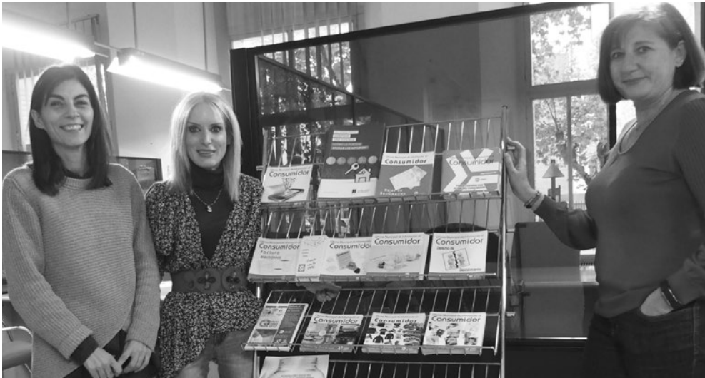
Equipo de trabajo de la OMIC.