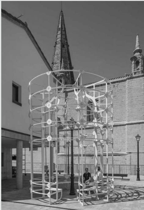
Instalación en la Plaza de Santa Ana.