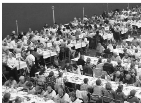
Acto de socialización en el Día de las Personas Mayores.

Cualquier persona que quiera colaborar en la detección de situaciones de soledad puede llamar a la Unidad de Servicios Sociales.