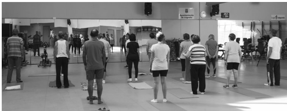
Personas mayores en una actividad deportiva.

Estos talleres refuerzan y complementan el