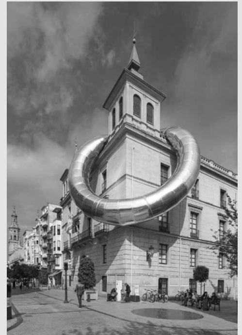
Instalación en el IER.