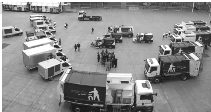
Parte de la flota renovada de vehículos de limpieza.

Se han incorporado 46 nuevos equipos y renovado 2.200 contenedores. Los equipos vie-