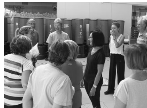
Personas mayores en una sesión de ejercicios.