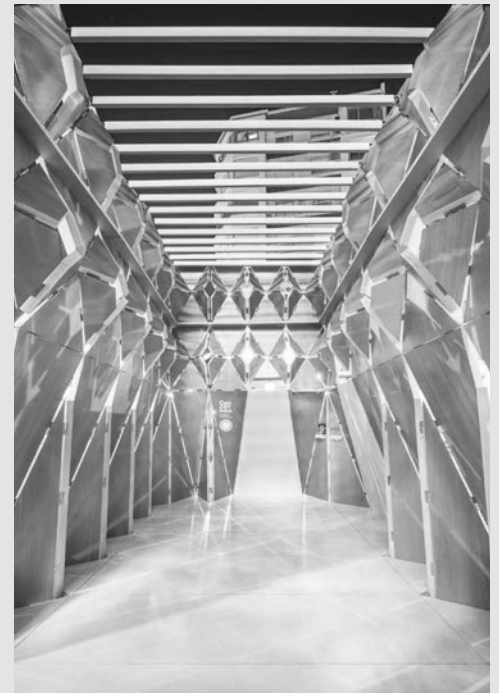
Pabellón de 'Concéntrico'.

Desde 2015, 'Concéntrico' ha reunido en Logroño 59 instalaciones urbanas creadas por equipos de arquitectos y diseñadores nacionales e internacionales.