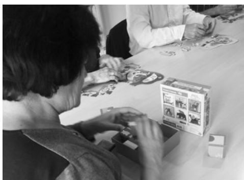
Taller de memoria.