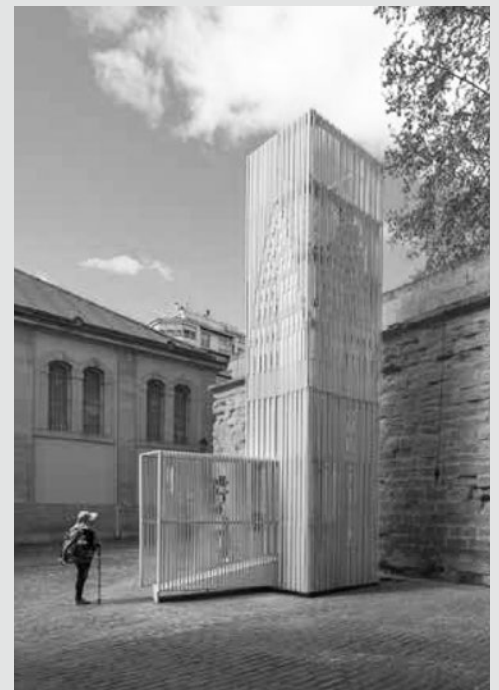
Intervención en la Plaza del Parlamento.