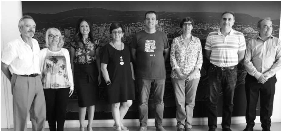
Algunos de los responsables de la Mesa de la Pobreza