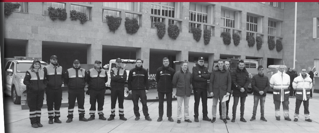
Representantes del operativo que está integrado por Protección Civil, Parque de Servicios, Policía Local, Bomberos, Medio Ambiente y Aguas, SOS Rioja y Cruz Roja.