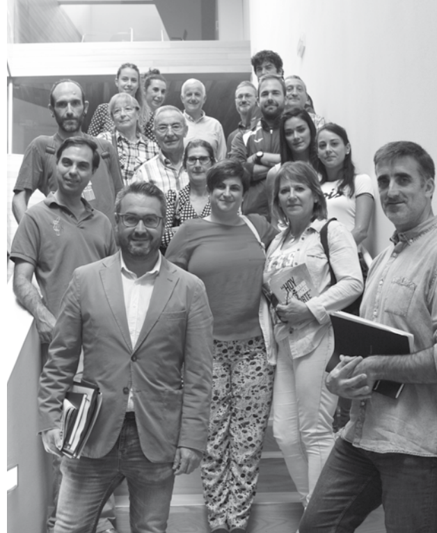
Defensa Personal y Campo de Golf FCC.

Logroño Deporte ha alcanzado también para esta temporada 29 acuerdos con estas entidades deportivas: FERDIS (discapacidad). Las Federaciones Riojanas de: Natación, Gimnasia, Judo, Karate, Atletismo, Esgrima, Pelota, Bádminton, Voleibol, Ciclismo, Tenis, Fútbol y Baloncesto. Junto con los Clubes: Deportivo San Cosme y San Damián de Varea (pelota), Club Balonmano Ciudad de Logroño, Club Riojano de Actividades Subacuáticas, Tiro con Arco Eypos, Hípica, Asociación Senda (Entrena corriendo), Club Taekwondo Ciudad de Logroño, Club Rioja Hielo, Logroño Billar Club, Milenio Club Patín, Tiro Club Rey Pastor, Club Rioja Hielo (Patinaje sobre hielo), Club Anda y Corre, Club Promoción