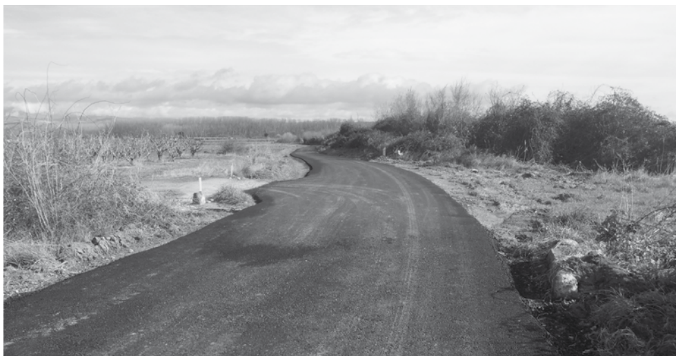
Pasada del Espinal (Varea)

Asimismo, se mantiene el contacto con los vecinos que son quienes conocen de primera mano las principales necesidades; las trasladan y con los técnicos municipales se procede a elegir los términos más urgentes en donde actuar.