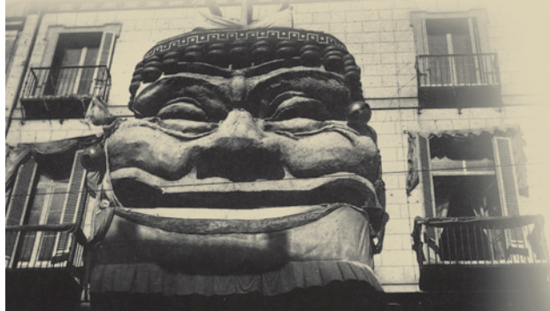
Decoración de fachada durante los carnavales hacia 1934.

También las instituciones privadas tienen su propia programación festiva. En el Gran Casino, cuentan las crónicas, se realizó el baile más animado protagonizado por la "sociedad" logroñesa, que también se dio cita en el aristocrático Círculo Logroñés, que se esmeró con un gran baile de disfraces. En La Amistad se juntaron y bailaron los jóvenes trabajadores y los bailes de la Sociedad 30 de mayo fueron animados por la Tuna Logroñesa. Valses, rigodón y matchicha por doquier. Mientras, en Casa Piazuelo se preparan para la Cuaresma recibiendo género específico para los días de abstinencia: langa (una variedad de bacalao) extra, escocia superior (bacalao de Escocia), habas de Mansilla, caparrones de Torrecilla, garbanzos de vigilia castellanos, lentejas de Salamanca, arroz bomba de paella, langostinos y calamares, sardinas en aceite y escabeche, atún, bonito y ton meriné.