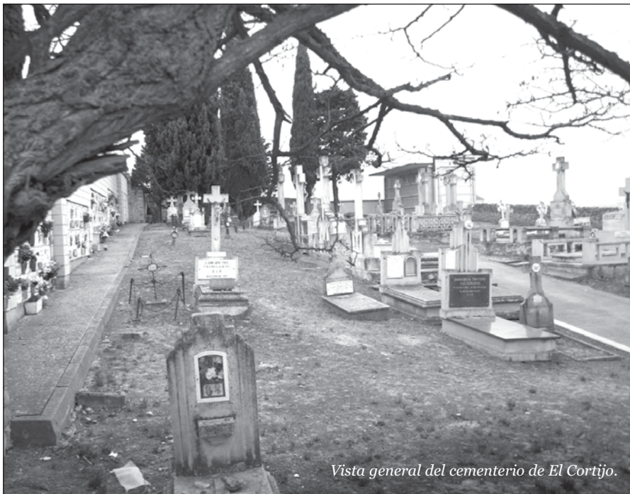
Vista general del cementerio de El Cortijo.

Repasemos, por tanto, la historia y las características de estos dos cementerios, el de El Cortijo y el de Varea, cobijados de tantas medulas que han gloriosamente ardido.