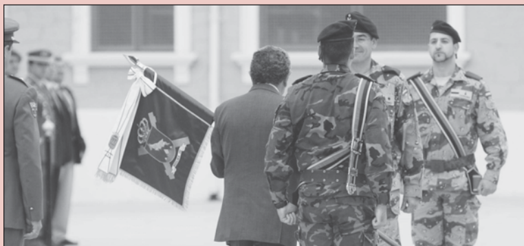
El alcalde entregó un estandarte con el escudo de la ciudad al jefe del destacamento.

Este grupo militar trabajará en la zona de Herat y su regreso a España está previsto para el mes de marzo de 2010.