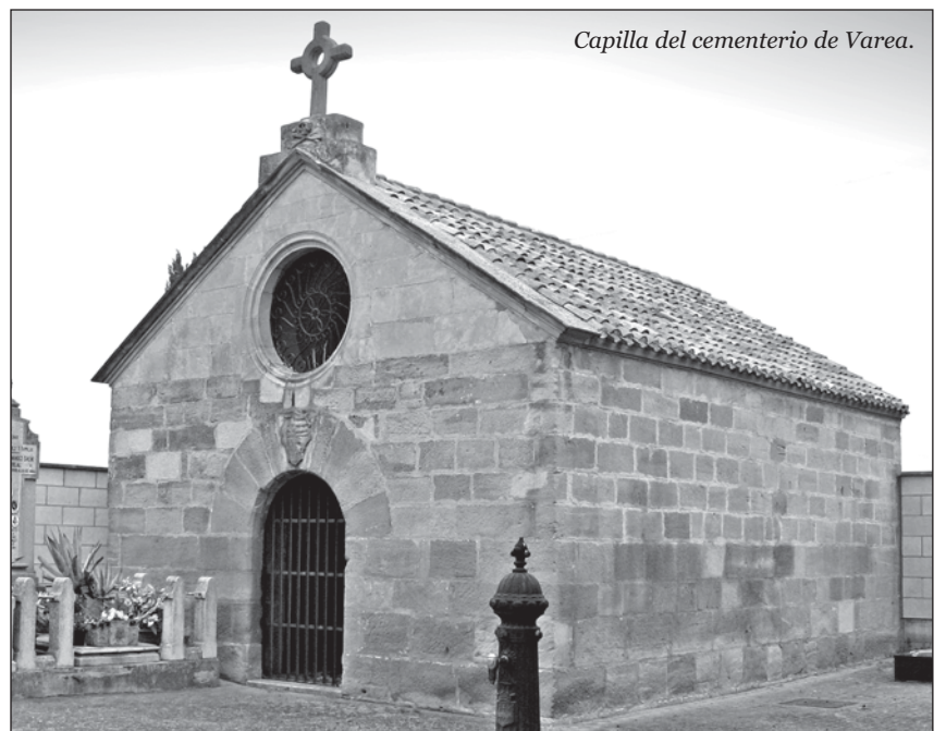
Capilla del cementerio de Varea.

Se llevó a cabo el derribo del muro perimetral y se construyó uno nuevo; se habilitaron nuevos cuadros de panteones y nichos; se cambió el pavimento; y se rehabilitó la capilla que aparece junto a estas líneas. Esta capilla, que antaño fue Ermita de Santa María La Blanca, y la puerta de acceso al cementerio, de aire clasicista, son los elementos arquitectónicos más destacados del recinto. En nuestros días el cementerio de Varea cuenta con 440 enterramientos distribuidos en nichos y tumbas. El recinto no conserva ninguno de los panteones antiguos.