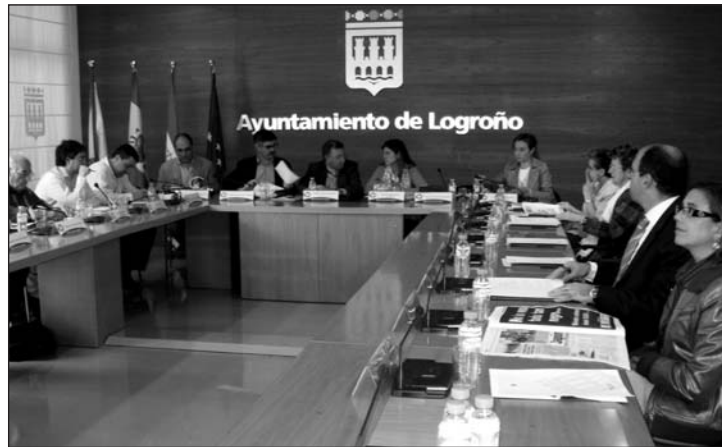
■ Reunión del Consejo Social para estudiar la situación del Casco Antiguo

Por último, todo el Consejo Social valoró positivamente la obtención de ayudas del Plan Urban para el proyecto integral del Casco Antiguo, algo que ha sido posible gracias al apoyo del propio Consejo y de otras entidades de la ciudad de Logroño.