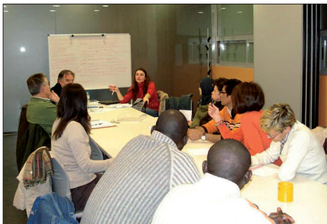
■ La Casa de las Asociaciones dispone de aulas y salas de reunión adaptadas para el desarrollo de cursos y talleres.

La Casa de las Asociaciones está en el Paseo Francisco Sáez Porres, 1-3 (Parque San Antonio), y permanece abierta de lunes a viernes de 9 a 14 y de 17 a 22 horas. Los sábados