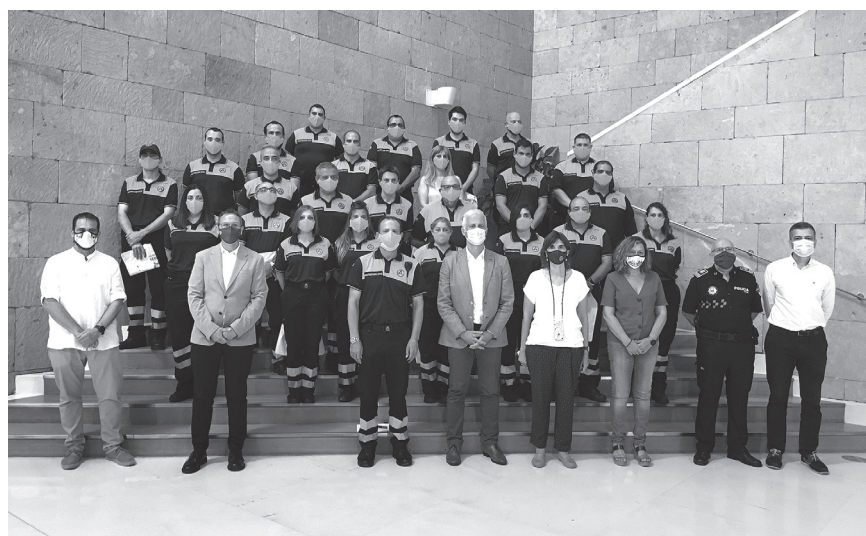
■ Foto de familia con los 35 voluntarios y voluntarias de Protección Civil de Logroño.

Protección Civil de Logroño es un servicio municipal respaldado por voluntarios y voluntarias que apoya a otros cuerpos profesionales para garantizar la seguridad de la ciudadanía.