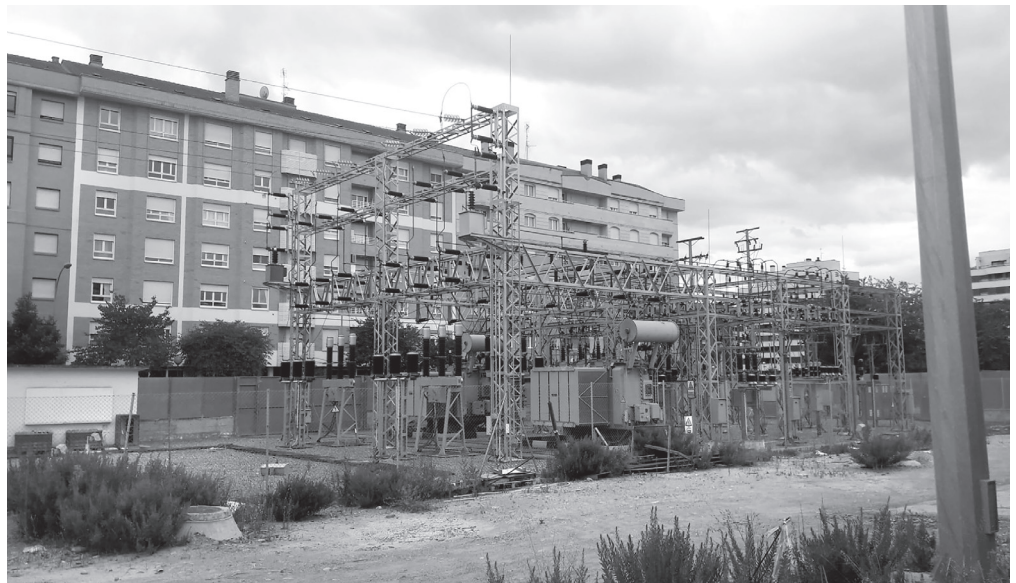
■ La subestación estará soterrada y sus edificios se integrarán en el entorno de las estaciones.

Las conversaciones abiertas desde hace dos años entre el Ayuntamiento de Logroño e Iberdrola para estudiar la ubicación de la subestación eléctrica de Cascajos, un asunto sin resolver desde hace más de una década, han dado sus frutos. El alcalde y el responsable de Iberdrola han suscrito uno de los convenios más esperados y más importantes de esta ciudad: el referido a la subestación eléctrica de Cascajos, que tendrá un coste total de 5.895.533 euros. Iberdrola participará en los costes de ejecución de esta instalación con 1.500.000 euros, por lo que el importe neto que el Ayuntamiento de Logroño aportará será de 4.395.533 euros.