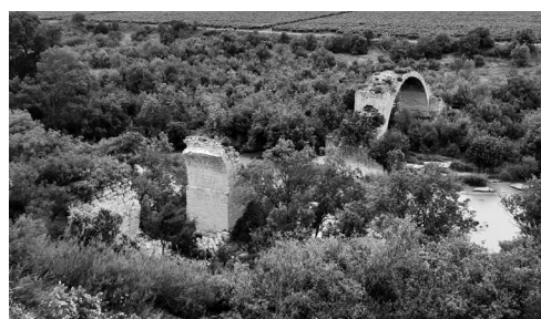
El puente Mantible en la actualidad.