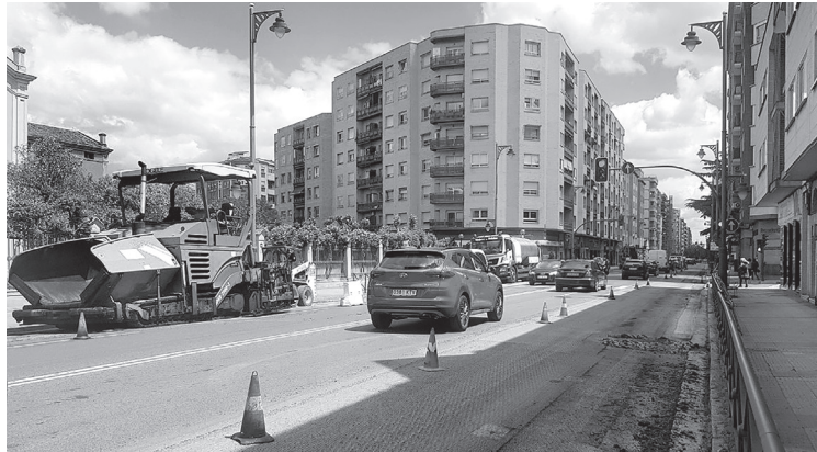
■ Los trabajos de asfaltado ya han comenzado en la calle Murrieta.

E l Ayuntamiento de Logroño ha iniciado las obras de refuerzo de firme y asfaltado de la calle Murrieta, en el tramo comprendido entre Gran Vía y la rotonda de Carmen Medrano. Posteriormente se mejorarán dos tramos de la calle Chile y Vara de Rey. Estas actuaciones cuentan con un presupuesto de 196.743,53 euros.