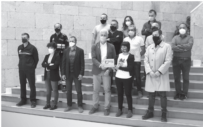
■ El alcalde, junto a los responsables del equipo técnico municipal.

El alcalde de Logroño, Pablo Hermoso de Mendoza, ha compartido con los responsables del equipo técnico municipal el Premio Nacional de Movilidad concedido al proyecto ‘Logroño Calles Abiertas’. Junto con el concejal de Desarrollo Urbano Sostenible, Jaime Caballero, el alcalde les ha agradecido su implicación y el trabajo desarrollado en los últimos meses, que ha hecho que esta iniciativa haya sido referencia nacional de movilidad sostenible.