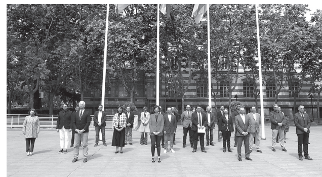
■ Autoridades y responsables del CIBIR durante el acto de entrega del premio.

El alcalde de Logroño, Pablo Hermoso de Mendoza, ha reivindicado "la ciencia y la investigación en el ámbito de la salud" y ha valorado "el trabajo de investigadores y de investigadoras que con su trabajo vencen pandemias y des-