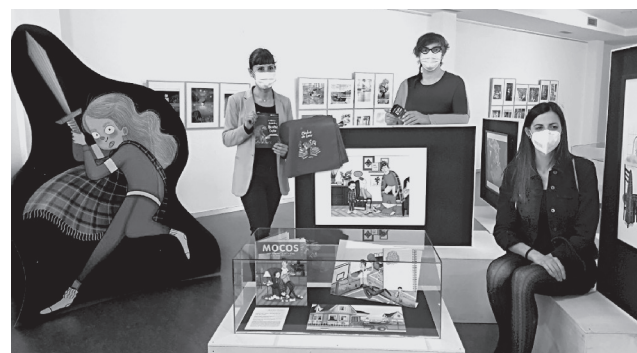
■ La concejala de Cultura, la directora de la Biblioteca y la ilustradora riojana, en la presentación de la exposición.

La exposición se complementa con dos talleres educativos para acercar la obra de esta artista riojana, cada uno con dos sesiones de una hora y con capacidad para diez personas. El primero, 'Taller de ilustración de cuentos', se realizará el día 15 de mayo; y el segundo, 'Taller de ilustración de personajes', se llevará a cabo el 3 de julio. Las inscripciones pueden realizarse presencialmente en la biblioteca;