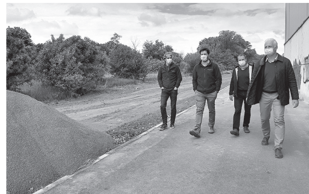
■ El alcalde, el concejal de Desarrollo Urbano Sostenible y empresarios del Polígono Cantabria visitan los trabajos.

El alcalde de Logroño ha confirmado la intención del Ayuntamiento de proporcionar accesos a los polígonos, “algo que ya se recogía en el Plan de Movilidad Urbana Sostenible de 2013, pero que no se avanzó en la anterior legislatura. Nuestra intención es integrar los polígonos en la ciudad y con este paso inferior ofrecemos una alternativa a las personas que vienen en autobús para pasar del sector este al oeste del polígono”. Además, se responde a una reclamación histórica de la asociación de empresas del Polígono Cantabria para promover la movilidad en bicicleta hasta el polígono. También se ha iniciado el trámite para estudiar la futura instalación de un voladizo en el puente de la A13.