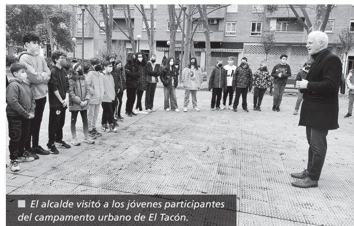
■ El alcalde visitó a los jóvenes participantes del campamento urbano de El Tacón.

Además de estos campamentos urbanos para jóvenes, durante este periodo de días no lectivos, las ludotecas municipales han ofertado 364 plazas, el mismo número que habrá para las vacaciones de Semana Santa. Estas iniciativas municipales tratan de favorecer la conciliación laboral y familiar de la ciudadanía logroñesa.