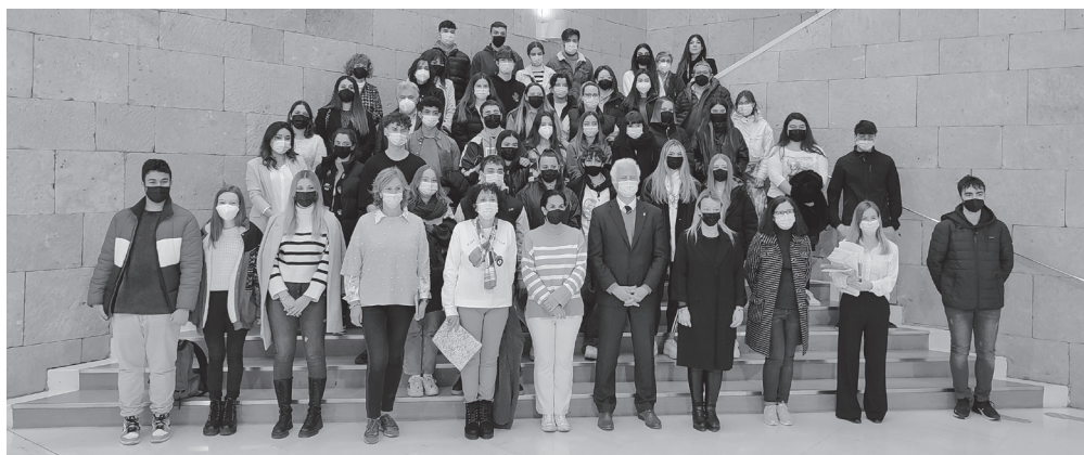
■ Alcalde y concejala de Economía junto a los jóvenes participantes del programa 'Logro-Europa IV'

En esta edición, a la que el Consistorio aporta 168 859 euros, se han asignado nueve plazas al IES Comercio; tres al IES Batalla de Clavijo; nueve al IES La Laboral; ocho al IES Duques de