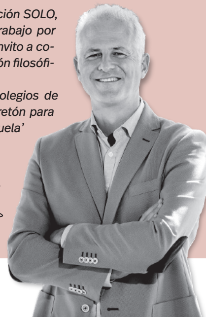
Pablo Hermoso de Mendoza | Alcalde de Logroño

Y, para terminar, quiero agradecer a los colegios de la ciudad que vuelven en marzo al Teatro Bretón para disfrutar de la campaña 'El Bretón en la escuela' después de dos años. Nuevos espectadores para nuestra cultura.