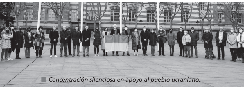
Concentración silenciosa en apoyo al pueblo ucraniano.

Logroño se sumó a las concentraciones silenciosas convocadas por la Federación Española de Municipios y Provincias (FEMP) en diferentes ciudades de España en solidaridad con el pueblo ucraniano. La plaza del Ayuntamiento rindió homenaje a la ciudadanía de este país.