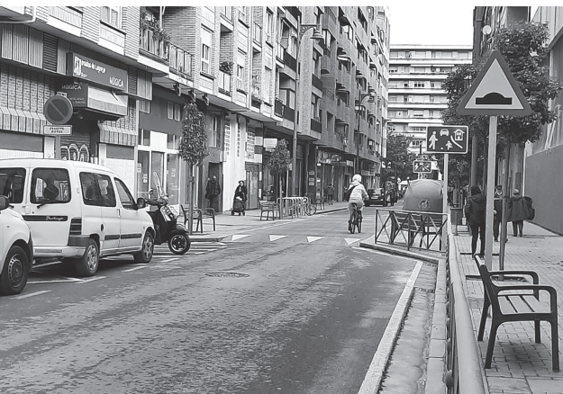
■ Las obras en la calle Múgica han dado lugar a una plataforma peatonal frente a Los Boscos.

Ya han finalizado las obras de la calle Múgica, en el tramo entre Pérez Galdós y Gran Vía, para mejorar los itinerarios peatonales y el entorno escolar. Se ha creado una gran plataforma peatonal elevada en el centro de la calle, frente al colegio Los Boscos, similar a la realizada en 2021 en la calle Belchite, en el entorno de Agustinas.