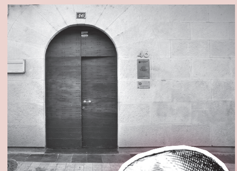
Casa de Rodrigo de Cabredo, en la calle Mayor nº46.