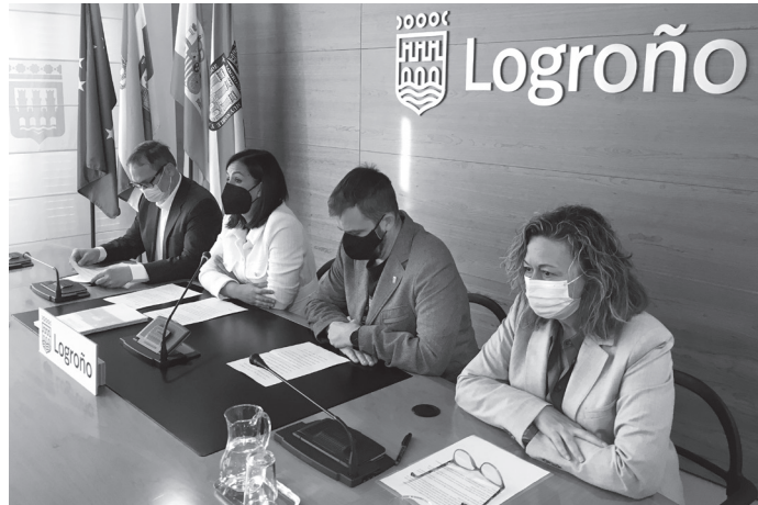
■ La concejala de Hacienda, junto a los portavoces de PSOE, UP y PR.

Las familias contarán con una ayuda económica, ya que el IBI bajará del 0,60% actual al 0,59%. Respecto al comercio local, los negocios que no estén situados en el Centro Histórico verán incrementada la bonificación del IBI hasta el 90% –actualmente en el 75%–, y los del Centro Histórico mejorarán la bonificación en un 5%, ya que pasará del 90% al 95%, el máximo posible. Se trata de “un nuevo estímulo a la recuperación económica que aligera la carga fiscal a la ciudadanía y a las empresas”, ha indicado la concejala.