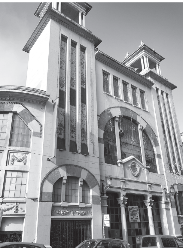
■ El Mercado San Blas, protagonista de alguno de los proyectos presentados.