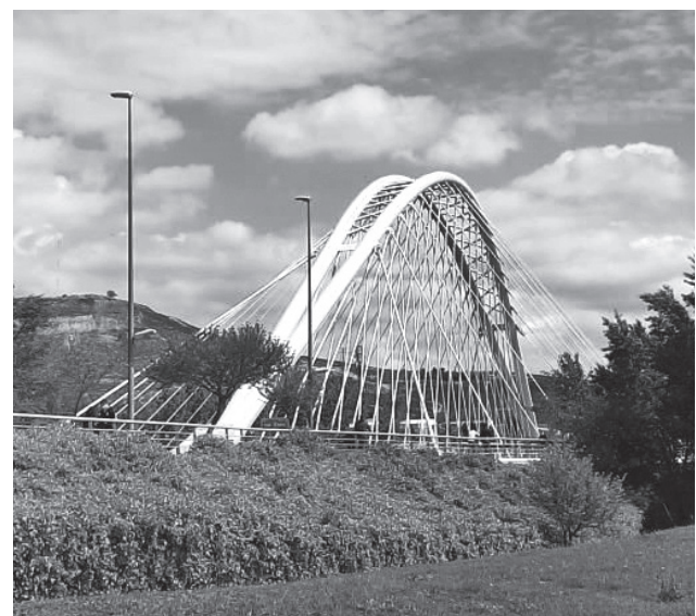
■ Vista actual del Puente Sagasta desde El Cubo.

Entre otras actuaciones, se realizará una limpieza general de la estructura, reparación de fisuras, desconches y roturas de hormigón, sustitución de las juntas de dilatación del tablero, tratamiento de los pretiles metálicos y barreras de hormigón, mejoras en el pavimento, drenaje del tablero, tratamiento del arco, celosías y barandillas, así como del pavimento de las pasarelas o la sustitución de proyectores de iluminación por otros más estéticos y eficaces.