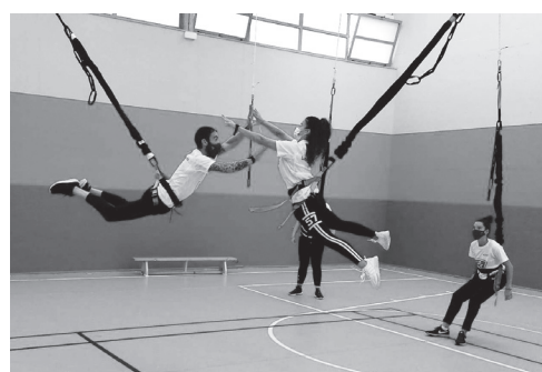
■ Jóvenes practicando ‘bungee workout’.

“Logroño Deporte siempre está innovando, ofreciendo las últimas tendencias junto a los