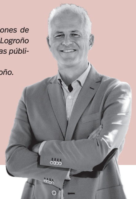
Pablo Hermoso de Mendoza | Alcalde de Logroño

Buenas noticias para avanzar durante este otoño.