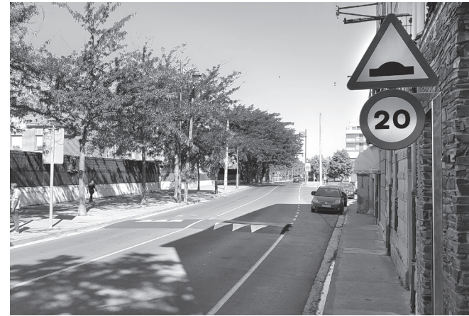
■ Reductor de velocidad instalado en la calle Cabo Noval, 12.

Estas actuaciones de calmado de tráfico se suman a las que se están desarrollando en estos momentos para la instalación de nuevos pasos peatonales elevados. Actualmente se ejecuta el de Vara de Rey, a la altura del pasaje de San Antón.