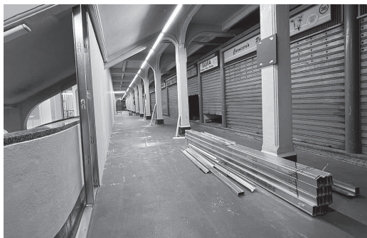
■ Trabajos de sectorización en la segunda planta del mercado.

L as obras de rehabilitación del Mercado de San Blas ya están en marcha. Tras haberse llevado a cabo las tareas administrativas en la primera semana de agosto, el pasado día 8 comenzaron los trabajos de sectorización. Se trata de un proyecto, cuyo plazo de ejecución es de ocho meses, realizado gracias al Plan de Recuperación, Transformación y Resiliencia - Financiado por la Unión Europea - Next GenerationEU a través del Ministerio de Industria, Comercio y Turismo. Durante todo el desarrollo de las obras, la plaza de Abastos permanecerá abierta y la actividad comercial se mantendrá.