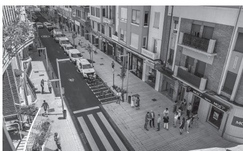
■ Renovación de las luminarias en la calle Gran Vía y en la reformada República Argentina.

Logroño lleva tiempo mejorando su eficiencia energética y reduciendo el consumo. El Ayuntamiento ha incorporado la tecnología necesaria para reducir costes que repercutan en la ciudadanía.