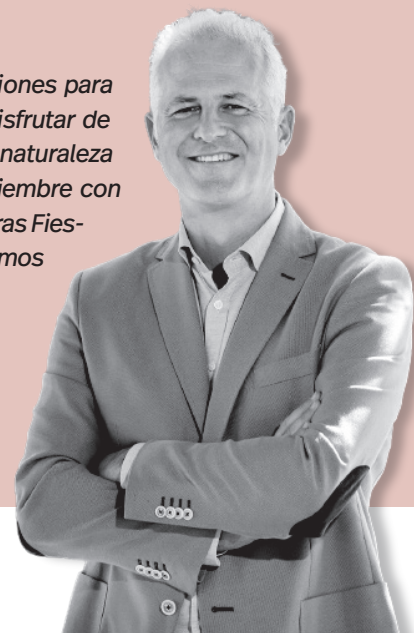
Pablo Hermoso de Mendoza | Alcalde de Logroño

que también aprovechen agosto y las vacaciones para moverse, que las vacaciones les permitan disfrutar de paseos en entornos diferentes, ojalá en la naturaleza y hagan actividad física, para volver en septiembre con ganas y fuerzas para celebrar de nuevo nuestras Fiestas Mateas, en las que, mientras tanto, seguimos trabajando.