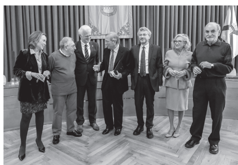
■ Diferentes momentos antes y después del acto institucional, celebrado en el Ayuntamiento de Logroño en honor a Rafael Moneo.