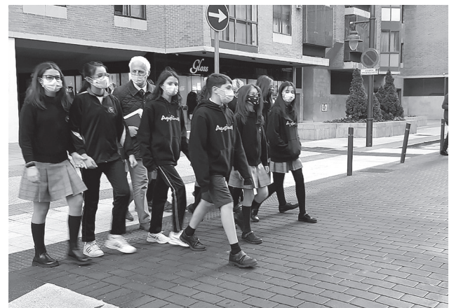
El alcalde y escolares de Agustinas cruzan el nuevo paso peatonal de la calle Belchite.

En el IES Cosme García, el alcalde también ha explicado las acciones en materia de movilidad que se han desarrollado cerca del centro, como el paso peatonal elevado en la calle República Argentina, la plataforma única en la calle Francisco de Goya, que ahora une el centro con el polideportivo Las Gaunas, o la instalación de aparcamientos de bicicletas.