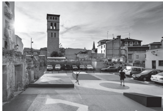
■ Plaza de La Villanueva.

La concejala ha subrayado que la estrategia original de recuperación de La Villanueva "tenía errores importantes, como cuantías que no cuadraban, no conectaba con los objetivos necesarios para obtener