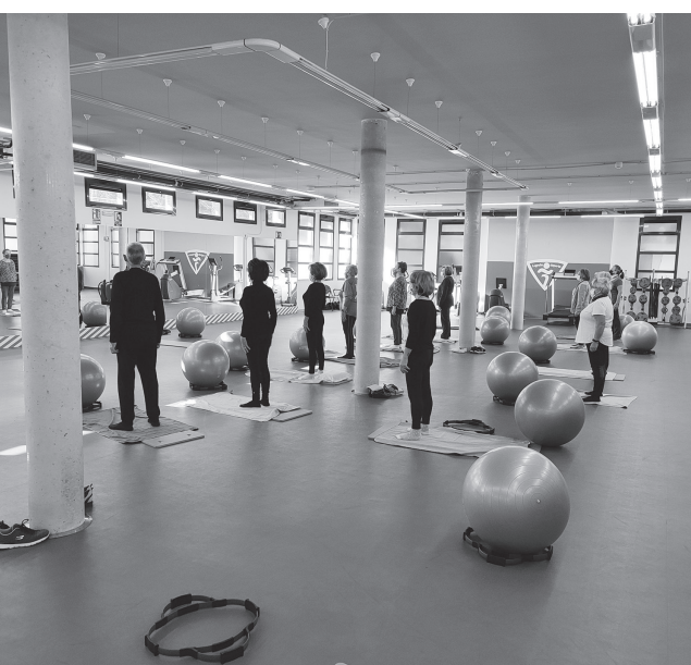
■ Nueva sala acondicionada en Pradoviejo para la realización de diferentes actividades deportivas.

Uno de los objetivos que Logroño Deporte se ha marcado para esta legislatura es sacar un mayor rendimiento a las instalaciones deportivas y abrirlas a nuevos usos. Así se ha hecho en Las Norias, en el estadio de Las Gaunas y, ahora, en Pradoviejo.