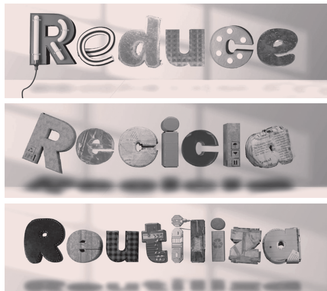
■ Imágenes correspondientes a la campaña municipal de sensibilización ciudadana para tratar de reducir residuos, reciclar y reutilizar los productos.

Los consejos que se distribuyen en esta campaña son “pequeños gestos”, como cocinar con alimentos frescos, reciclar en los puntos limpios de la ciudad, comprar en los comercios del barrio, donar la ropa utilizada, ir a comprar con una bolsa propia de tela o un carrito, llevar botellas de aluminio al trabajo o tirar las colillas a una papelería, entre otros. Las recomendaciones se pueden seguir también en las redes sociales, en las calles y en la web: logroño.es/prevencionresiduos .