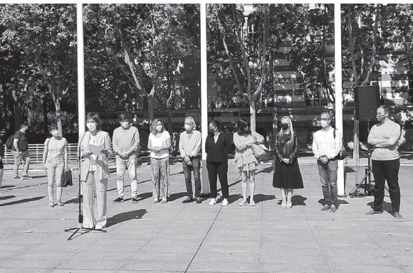
■ Varios representantes de la Corporación municipal participan en la concentración.