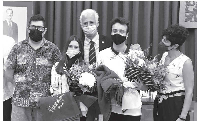
■ Los nuevos vendimiadores, en presencia del alcalde de Logroño y de sus antecesores.

Un jurado ha elegido el cartel ganador de las fiestas. Al concurso se presentaron 49 carteles diferentes.