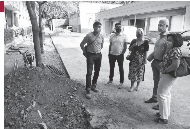
■ El alcalde de Logroño y la concejala de Educación visitaron los trabajos en el CEIP Milenario de la Lengua.

por planta. Las obras comenzaron el 13 de julio y se estima que finalicen el próximo 30 de agosto. Estas obras forman parte de los proyectos programados para este año y que disponen de un presupuesto cercano a los 300.000 euros, entre las que figuran también trabajos en los colegios San Francisco, Vuelo Madrid-Manila, Navarrete el Mudo, Gonzalo de Berceo o Duquesa de la Victoria.