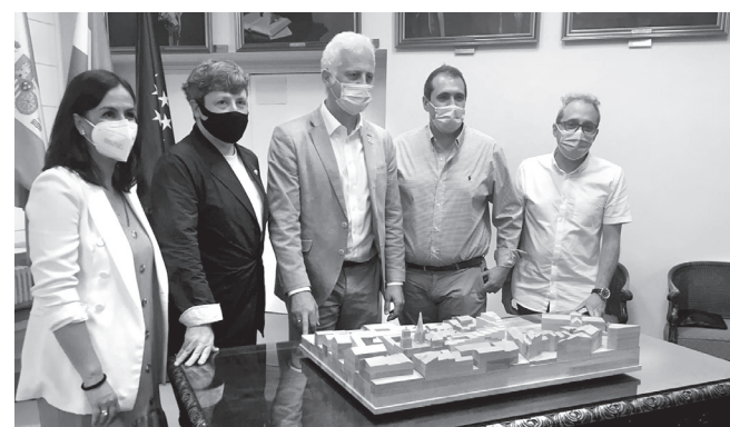
El alcalde y la concejala de Economía, junto a responsables de la empresa Bosonit, en la presentación del proyecto.

Desde el Ayuntamiento, remarcó, "se está haciendo todo el esfuerzo para facilitar la actividad económica en el Centro Histórico de la ciudad. Este proyecto va a mejorar Logroño y va a ser la pieza que permitirá que inversores nacionales e internacionales pongan el foco en Logroño como un espacio de oportunidades, no solo turístico sino también empresarial y residencial".