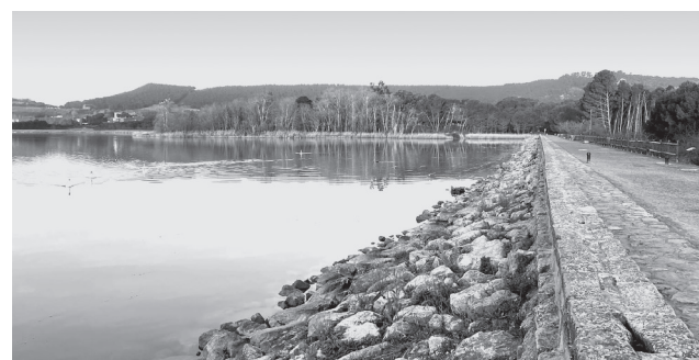
■ La presa de La Grajera ya tiene Plan de Emergencia.

La implantación del Plan de Emergencia conlleva, por exigencias normativas, la constitución de un comité de seguimiento, encargado de gestionar la información de emergencia en tiempo real, formado por un representante del Ayuntamiento, un representante de la Confederación Hidrográfica del Ebro, un representante de Protección Civil estatal y otro de Protección Civil de La Rioja. Este Plan si-