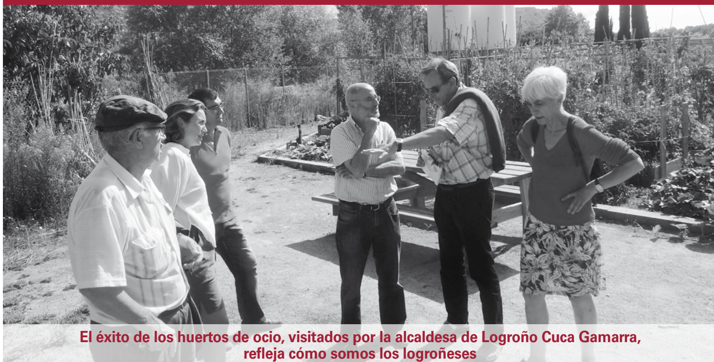
El éxito de los huertos de ocio, visitados por la alcaldesa de Logroño Cuca Gamarra, refleja cómo somos los logroñeses

“Una sociedad solidaria y respetuosa con el medio ambiente”