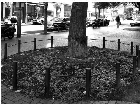
■ Los espacios urbanos estarán más naturalizados.

El Ayuntamiento deja de utilizar el herbicida glifosato para el tratamiento de los parques, jardines, carreteras y redes de servicio de la ciudad. Será sustituido por otros métodos no contaminantes que no dañen la salud ni el medioambiente y se defenderá la naturalización de los espacios urbanos, por lo que se permitirá la aparición de hierbas como una opción más ecológica.