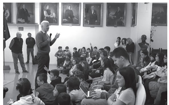
■ El edificio del Ayuntamiento cumple 40 años.