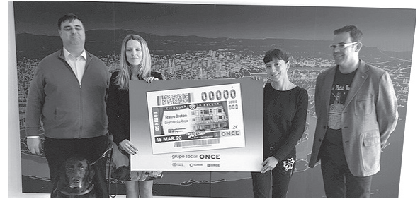
■ Un cupón dará a conocer el teatro Bretón.

La ONCE quiere que las personas conozcan la historia de estos teatros y salas. En los cupones habrá imágenes de los edificios de los teatros. Algunos teatros son más modernos y otros más antiguos.