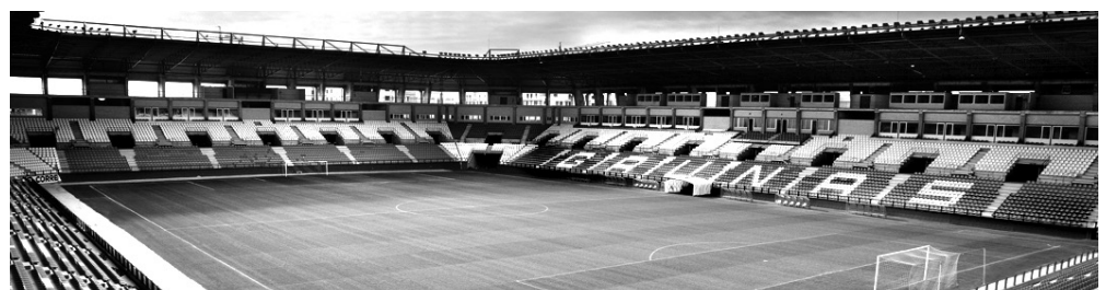
■ El Estadio de Las Gaunas mejora sus instalaciones.

cientemente, como la renovación de las cámaras de seguridad de la UCO. Asimismo, se está acometiendo una limpieza intensiva y mejora de los asientos del estadio. Además, durante los próximos meses, se adecuará una zona como sala de esgrima.