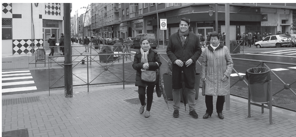
■ Nuevas aceras dan prioridad a los peatones.

Asimismo, se han ampliado las aceras, renovado las tuberías de abastecimiento,