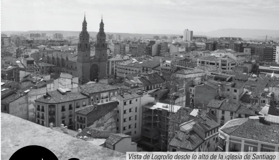
Vista de Logroño desde lo alto de la iglesia de Santiago

En el mes de agosto las visitas únicamente se realizarán los sábados y se interrumpirán el jueves y sábado de la semana de San Mateo.