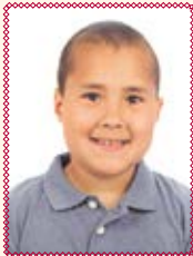
Lukas López Álvarez Gonzalo de Berceo