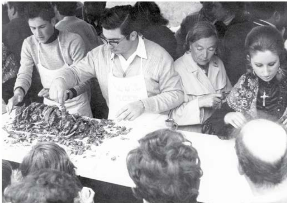
Reparto del pez, pan y vino en el año 1971

En 1522, Justicia y Regimiento de Logroño decidieron conmemorar el día de forma solemne e hicieron voto al santo Bernabé, al que el santoral asigna como festividad el día 11 de junio. Lamentablemente el documento original del voto, que debía encontrarse en el Archivo Municipal de Logroño, no se ha conservado, pero disponemos de una copia autorizada del mismo, datada en 1538, que se conserva en el Archivo Diocesano.