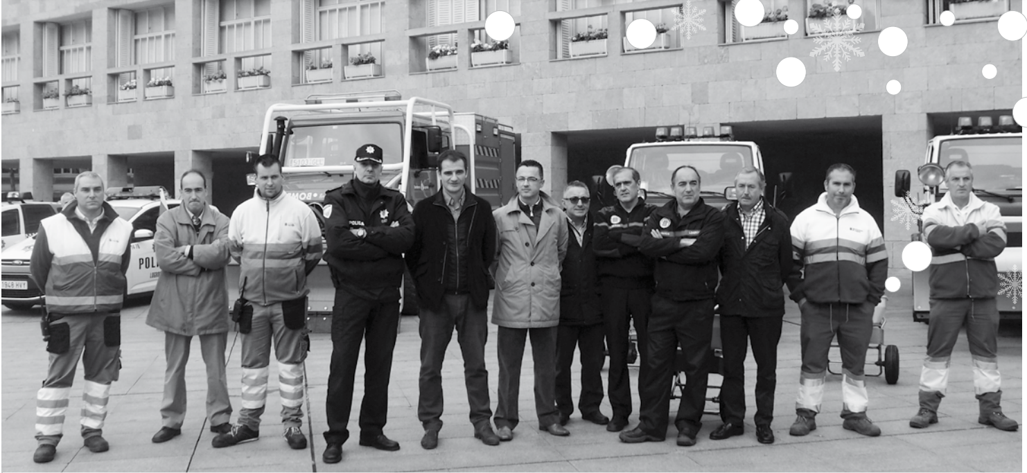
El operativo está integrado por Protección Civil, Parque de Servicios, Policía Local, Bomberos, Medio Ambiente y Aguas, SOS Rioja y Cruz Roja.

El Ayuntamiento habilita el plan especial para hacer frente a nevadas y olas de frío que pudieran producirse hasta finales de abril.