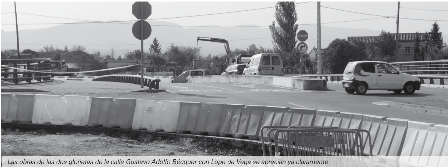
Las obras de las dos glorietas de la calle Gustavo Adolfo Bécquer con Lope de Vega se aprecian ya claramente

La alcaldesa resalta la importancia del continuo seguimiento de los proyectos