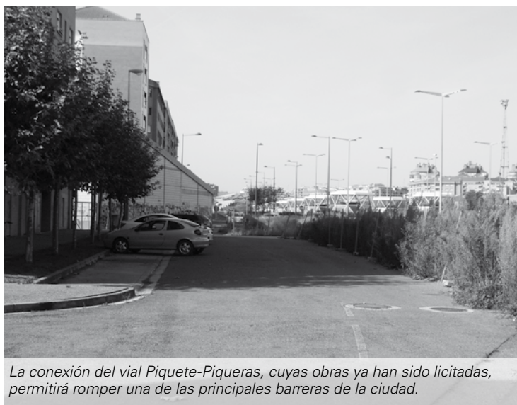
La conexión del vial Piquete-Piqueras, cuyas obras ya han sido licitadas, permitirá romper una de las principales barreras de la ciudad.