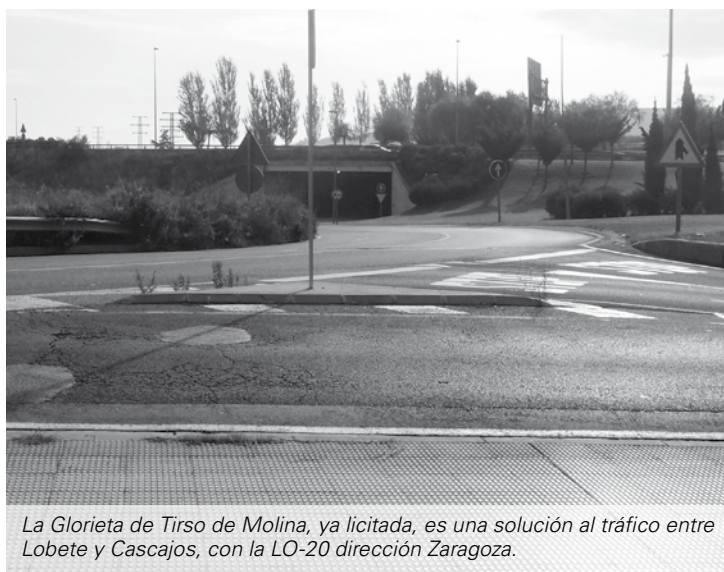
La Glorieta de Tirso de Molina, ya licitada, es una solución al tráfico entre Lobete y Cascajos, con la LO-20 dirección Zaragoza.