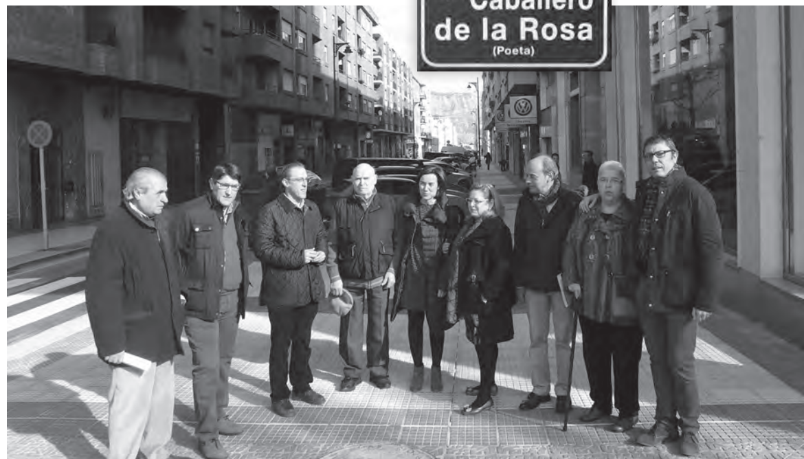
Miembros del Equipo de Gobierno y un grupo de vecinos comprobaron el resultado de las obras

En la renovación de los servicios se han empleado 860 metros de tubería de abastecimiento y conexiones. El nuevo mobiliario urbano ha consistido en 16 farolas, nuevos puntos de luz adaptados al reglamento de eficiencia energética sobre columna telescópica de 10 metros de altura;