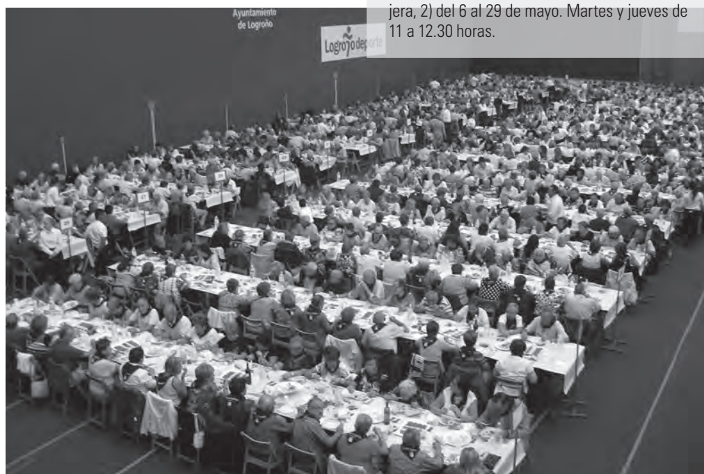
Hacia el mes de septiembre se celebra el Día del Mayor, con una gran asistencia de personas mayores y variedad de actos, en el polideportivo municipal Las Gaunas

El Ayuntamiento de Logroño acogerá próximamente las jornadas denominadas 'Formación para la acción de las personas mayores'. En estas jornadas, especialistas tratarán temas de interés para las personas mayores de gran actualidad, como los programas de acompañamiento, la relación de los mayores con las nuevas tecnologías, las formas de participación en la sociedad o las pensiones.