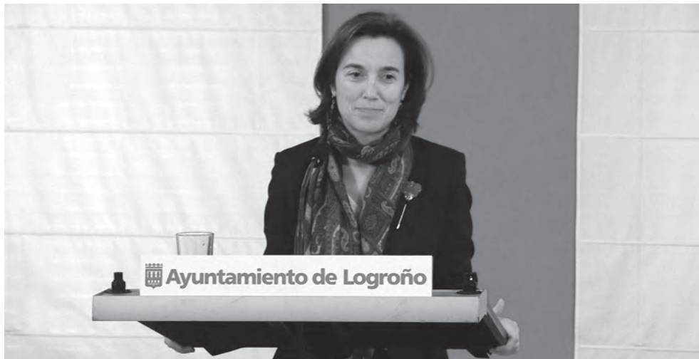
La alcaldesa de Logroño realizó un análisis de la situación de la ciudad

La alcaldesa de Logroño realizó un recorrido de las iniciativas en las que se está trabajando, por áreas, incidiendo en las