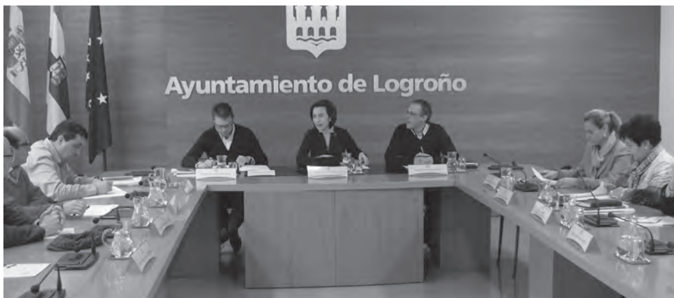
La alcaldesa de Logroño presidió la reunión del grupo de trabajo sobre desahucios, dependiente del Consejo Social

El grupo de trabajo del Consejo Social ha conocido la ayuda para compensar el pago de las plusvalías y las subvenciones al alquiler para estas familias