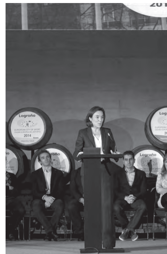
La alcaldesa de Logroño presentó un año de deporte en el Centro de la Cultura del Rioja