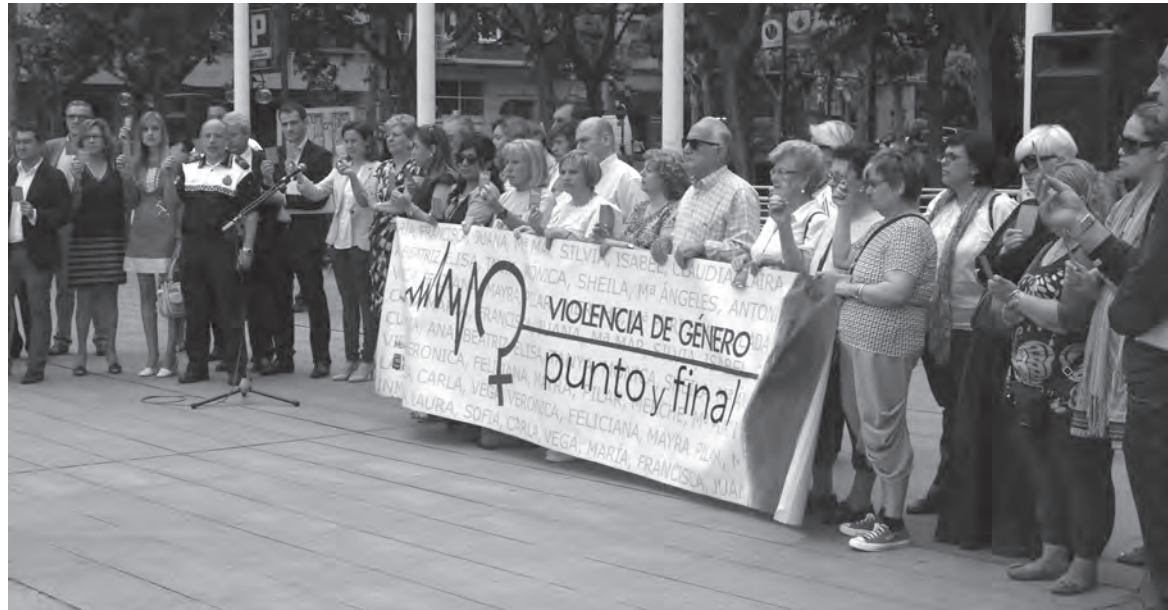
La Policía Local es uno de los principales instrumentos para combatir la violencia de género

Su función es proporcionar a las víctimas de violencia de género e intrafamiliar, la