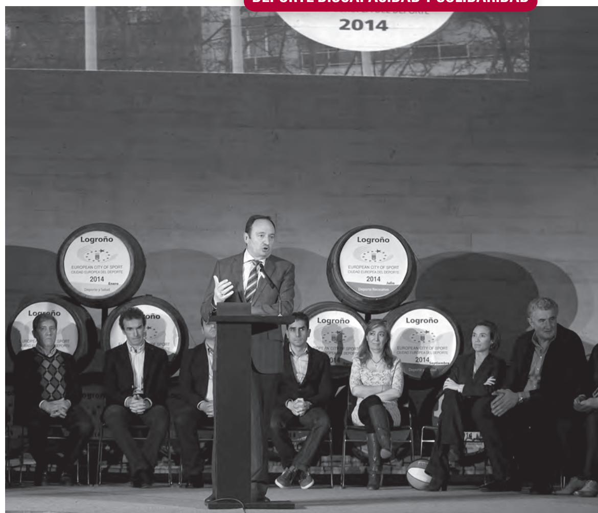
Pedro Sanz considera que la Ciudad Europea del Deporte supone "un hito en la historia de la ciudad y de La Rioja"