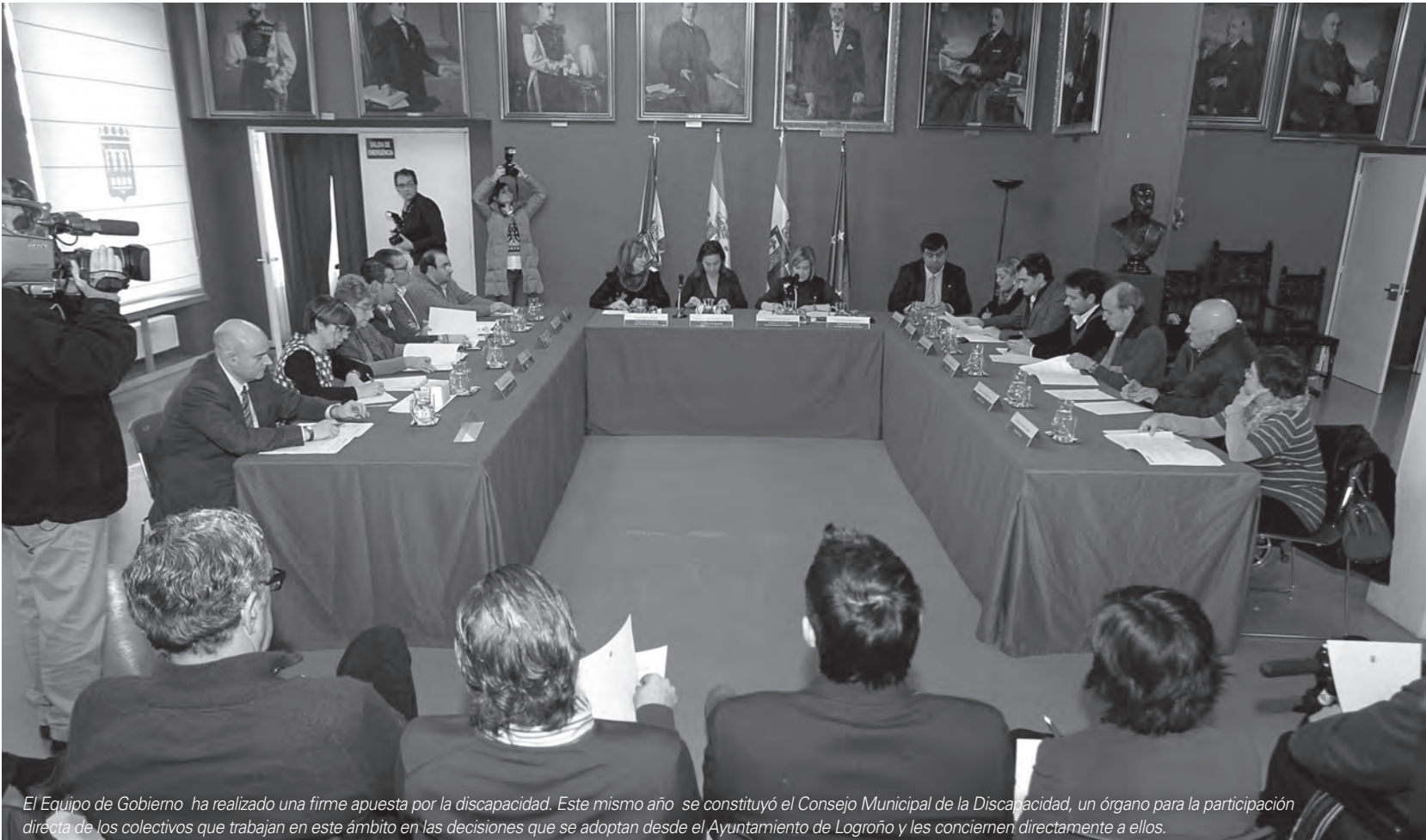
El Equipo de Gobierno ha realizado una firme apuesta por la discapacidad. Este mismo año se constituyó el Consejo Municipal de la Discapacidad, un órgano para la participación directa de los colectivos que trabajan en este ámbito en las decisiones que se adoptan desde el Ayuntamiento de Logroño y les conciernen directamente a ellos.

Logroño está mostrando su cara más social. Numerosos actos se han celebrado durante estos días para conmemorar el Día Europeo e Internacional de las Personas con Discapacidad, en los que el Ayuntamiento de Logroño está participando activamente en colaboración con los colectivos y con otras instituciones. Colaboración que no se ciñe a estos días, sino que durante todo el año se suceden las iniciativas para hacer una ciudad más inclusiva, que cuenta con todos, especialmente con quienes más lo necesitan. Del mismo modo, se revalida el convenio para desarrollar el programa ICI, una iniciativa que pretende fomentar la convivencia intercultural en los barrios de San José y Madre de Dios. En suma, actuaciones para edificar una sociedad más justa y solidaria.