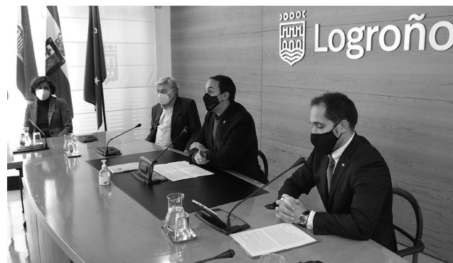
Responsables del proyecto presentan la investigación.

El proyecto de investigación, enmarcado en el programa del V Centenario, se lleva a cabo a través de un contrato OTRI (Oficina de Transferencia de Resultados de la Investigación) suscrito entre el Ayuntamiento y la UR y su objetivo es ofrecer a los investigadores un repositorio documental sobre los acontecimientos