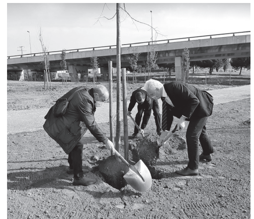
Alcalde y Bomberos plantan los últimos árboles en la segunda fase del Parque Juan Gispert.

Esta segunda fase del Parque Juan Gispert contempla una importante densidad de arbolado para reducir el ruido de la N-111 y luchar contra el cambio climático. Al área más cercana a la N-111 se le ha dotado de un carácter más forestal, mientras que en la zona más cercana a los viales urbanos se ha diseñado un ajardinamiento con césped, plantas rastreras y mancha arbustiva. Ambos sectores están separados mediante un camino central de tierra.