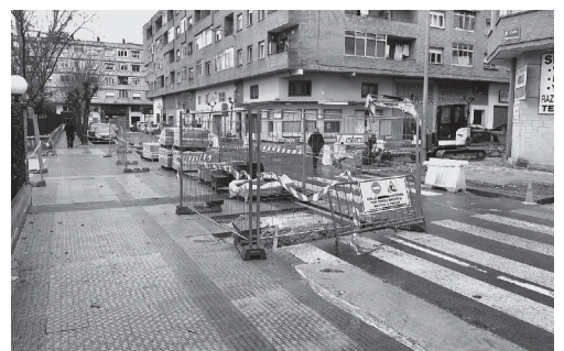
■ Diferentes imágenes de la calle Poniente y el entorno de CEIP Vicente Ochoa.

E l Ayuntamiento de Logroño ha iniciado las obras que avanzan en la pacificación del entorno de la Zona Oeste, comprendido entre las calles Gonzalo de Berceo, Carmen Medrano, General Urrutia y Plaza Diversidad. Se trata de la denominada 'Área Pacificada L', incluida en el Plan de Movilidad Urbana Sostenible de 2013, conocido como PMUS.