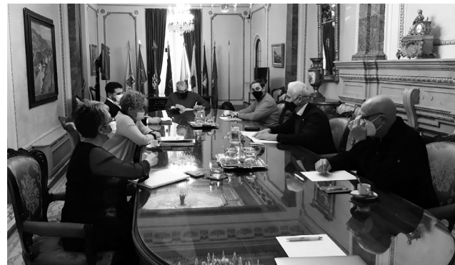
Reunión entre representantes del Ayuntamiento de Logroño y la Diputación de Álava, celebrada en Vitoria.

Si bien la gestión, conservación o restauración de cada parte del puente es independiente administrativamente, ambas instituciones lo consideran, en términos históricos, como un conjunto. “Así lo entiende también la ciudadanía, sin mirar si es riojano o alavés, sensibles con la memoria histórica de este legado patrimonial que podría tratarse de una obra que sirvió como paso de un ramal que comunicaba la vía que discurría por la