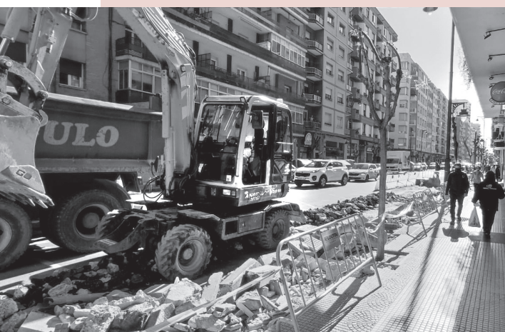
■ Las máquinas trabajan a buen ritmo en la calle Gonzalo de Berceo.

Las obras de mejora de la calle Gonzalo de Berceo avanzan según los plazos previstos y estarán terminadas para el mes de junio. La calle mantendrá parte de la ampliación peatonal y mejorará las paradas de autobús. Además, también servirá para ampliar las zonas de carga y descarga. Las mejoras han sido consensuadas con el vecindario y los comercios de la zona.