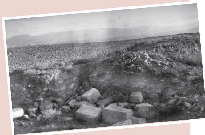
El yacimiento en agosto de 1956, Archivo municipal.

tegoría de Zona Arqueológica, tras un arduo proceso. La asociación Amigos de La Rioja había encabezado y canalizado el sentir de la población logroñesa solicitando formalmente el 20 de enero de 2004 la incoación del expediente necesario aduciendo numerosos motivos: su valor arqueológico, paleontológico, paisajístico, histórico, etnográfico, simbólico, social y urbanístico.