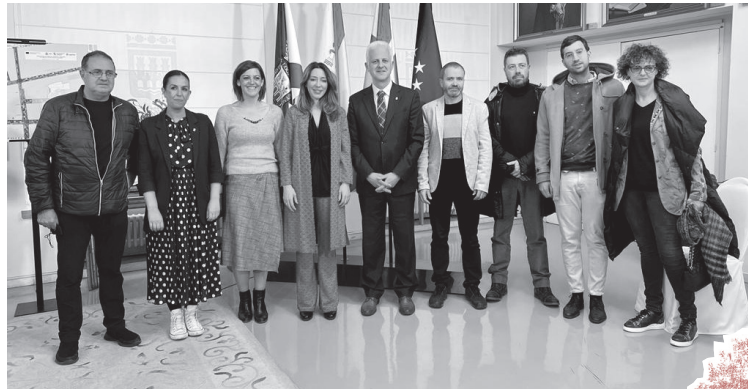
■ El alcalde y la secretaria de Estado, junto a comerciantes y equipo técnico municipal.

L a reforma de la zona de las Cien Tiendas incluirá la remodelación sostenible del pavimento y el mobiliario. El proyecto, que cuenta con 2,9 millones de euros de fondos europeos para su realización, está en fase de licitación, podría iniciarse en verano y finalizar antes de final de año.