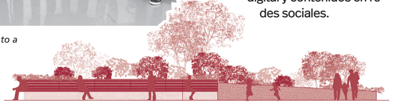
■ Detalles del proyecto, que incluye nuevo mobiliario, jardineras y arbolado. Además, el adoquinado será de pavimento absorbente y permeable.

zona. Además, también incidirá en la digitalización del sector comercial a través de la ampliación de red WiFi municipal (WiFi4EU) a las zonas comerciales, así como la puesta en marcha de una aplicación para pago de parking y una campaña promocional del comercio local integrando el marketplace, la red de cartelería digital y contenidos en redes sociales.