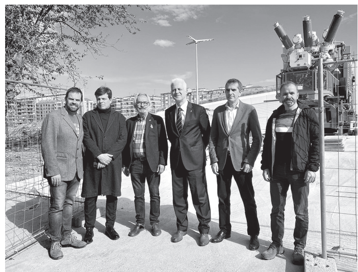
■ El alcalde, acompañado por varios concejales del Equipo de Gobierno y el delegado de Iberdrola en La Rioja, en la visita a la subestación móvil de Cascajos.

“La nueva subestación, con todos los equipos soterrados y la utilización de las últimas tecnologías disponibles en el sector eléctrico, mejorará la calidad de suministro, la seguridad y la afección ambiental”, afirmó el delegado de Iberdrola en La Rioja.