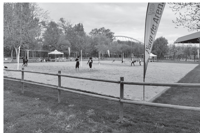
■ Polipista deportiva en Las Norias.

Su uso se ha organizado por días, ante la complejidad que supone quitar y poner anclajes y señalizaciones para cada deporte. La pista deberá ser reservada en Las Norias o en logronodeporte.es y tiene un precio de 30 euros por cada hora de utilización y pista completa, ya que hay deportes como el voleibol que únicamente necesitan un tercio de la pista y, por lo tanto, su coste es de 10 euros la hora. También se debe cubrir la entrada a Las Norias, gratuitamente en caso de ser abonado a Logroño Deporte y con la correspondiente tarifa si no se dispone de este carné. Para garantizar el uso de la pista debe formalizarse