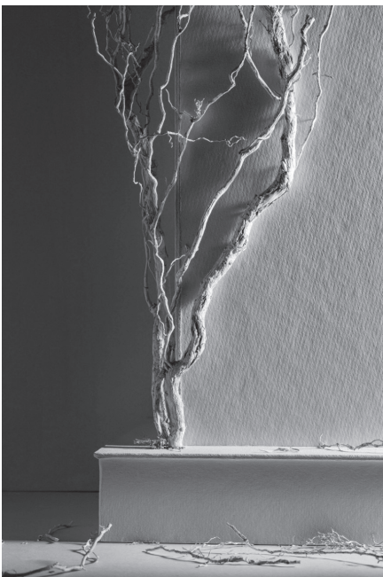
■ Imágenes del proyecto "Fotografía desnaturalizada" del fotógrafo Rafa Lafuente, uno de los premiados en 2021.

El Ayuntamiento dará 40 mil euros para estos premios. Habrá 8 proyectos premiados y cada proyecto recibirá 5 mil euros.