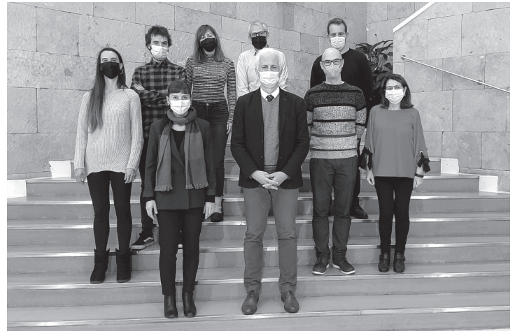
■ El alcalde y la concejala con los autores de los mejores proyectos del año pasado.

Los proyectos que se presenten a los premios pueden ser de temas de literatura, de teatro, de música o audiovisuales y de artes plásticas.