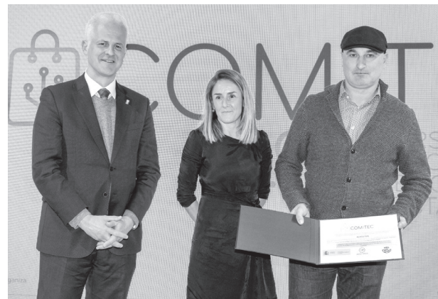
El alcalde de Logroño entrega un premio al Mercado del Corregidor.

Pickgeo Location Intelligence, Posteu, Intelligen Local Retail y Burgos Emociona fueron los premiados en las cuatro categorías. La primera, orientada a la tecnificación de los negocios comerciales con venta presencial; la segunda, destinada a empresas que gestionan dos canales: presencial y online; la tercera, para dotar de soluciones tecnológicas a las áreas comerciales urbanas; y la última, para la transformación digital del comercio en áreas comerciales rurales.