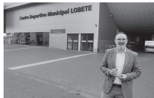
■ El concejal de deportes, en el polideportivo Lobete.

cionamos un espacio físico para que la juventud se junte a jugar, ya que no se debe olvidar el componente social y de relación que tiene el deporte".