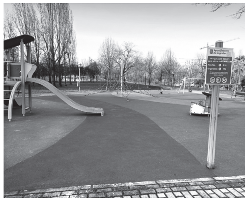
■ Área de juegos del parque San Miguel.

El proyecto tiene un presupuesto total de 83 724,99 euros y supone el cambio de unos 1 170 metros cuadrados de suelo de caucho. Estas obras se suman a las ya realizadas a lo largo del ejercicio anterior en otras nueve áreas de juegos infantiles, en la calle Cerámica, Segundo Arce, avenida Lope de Vega, avenida Manuel de Falla (tres zonas), Albia de Castro (dos zonas) y la urbanización San Adrián.