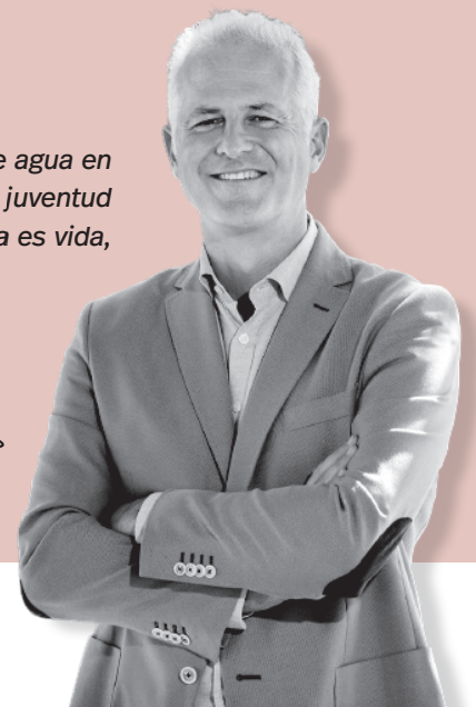
Pablo Hermoso de Mendoza / Alcalde de Logroño

eficiente y con menos consumo. El ahorro de agua en nuestras casas y la sensibilización a nuestra juventud también está en nuestra hoja de ruta. El agua es vida, hagamos un consumo responsable.