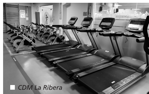
■ CDM La Ribera

La oferta de musculación es una de las más potentes que tiene Logroño Deporte, y recoge en un año más de 250.000 usos. Con el fin de dar satisfacción a esta alta demanda, además de las nuevas máquinas, se han introducido en los últimos meses otras importantes novedades, como un nuevo servicio en Las Norias para las mañanas de los sábados y ahora se permite la entrada desde los 14 años.