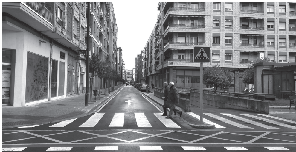
■ La calle Múgica en su cruce con la calle Huesca.

Las principales actuaciones se han centrado en la eliminación de barreras arquitectónicas, lo que ha supuesto una ampliación de las aceras hasta un ancho variable de entre 3,60 metros y de 3,10 metros; además de la creación de las orejas para mejorar la seguridad vial y accesibilidad en la intersección con la calle Somosierra.