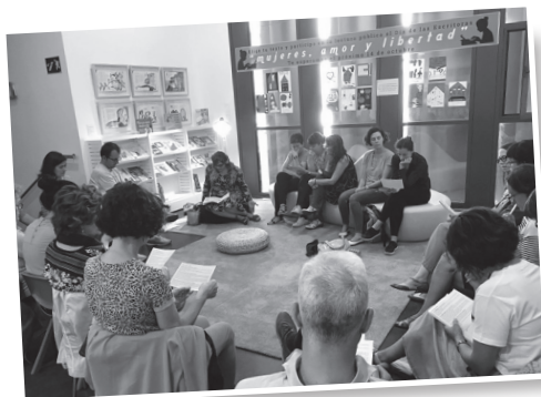
■ Taller de lectura para adultos.

pretende servir para concienciar sobre las desigualdades de género, cuestionar el modelo clásico de masculinidad, lograr un mayor entendimiento sobre las repercusiones del machismo en la sociedad, al mismo tiempo que se propicia un apoyo colectivo ante las dificultades individuales.