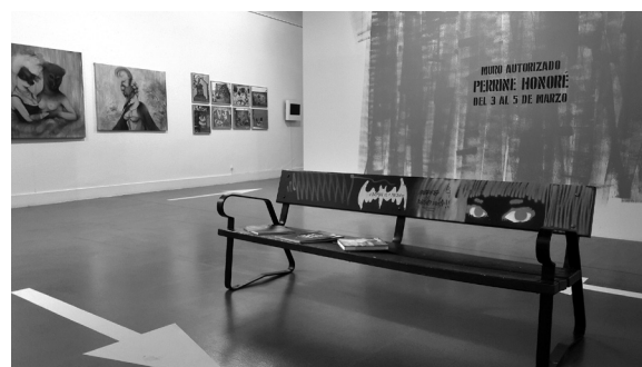
Diferentes imágenes de la sala Amós Salvador.