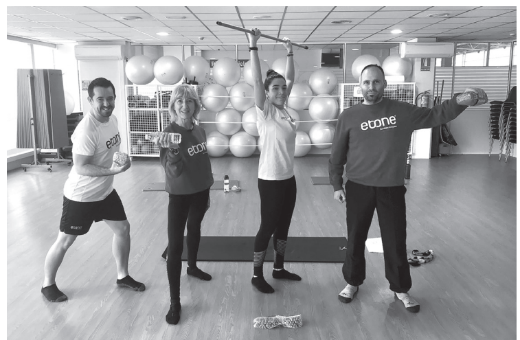
■ Instructores de Logroño Deporte imparten clases online.