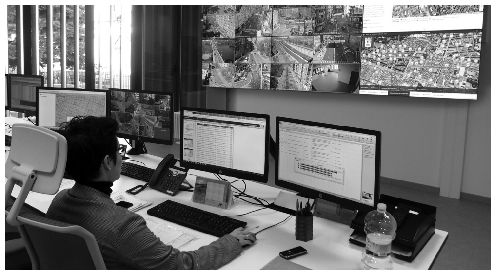
■ Para mayor información se puede contactar con el servicio 010.

Toda esta información es válida en el momento de impresión de este número de De Buena Fuente. También pueden informarse de las actualizaciones en la página web del Ayuntamiento de Logroño.