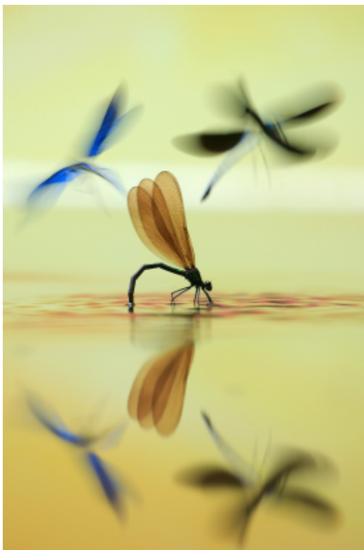
Marjan Arnatk. 'Ballet acuático'

E uropean Wildlife Photographer of the Year es uno de los concursos de fotografía de naturaleza más prestigiosos del mundo y está organizado por la Sociedad Alemana de Fotografía de Naturaleza (GDT). El certamen se celebra anualmente y con las mejores imágenes se forma una exposición, que viaja por decenas de países durante los meses que siguen a la celebración del certamen y la entrega de premios.