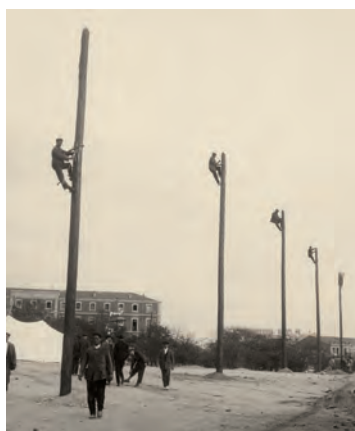
Alfonso, 1925. Escuela de Capataces y Celadores, Madrid

Por su carácter histórico y por el alcance de sus contenidos (más de siete mil imágenes realizadas entre los años 1924 y 1931), el Archivo Fotográfico de Telefónica tiene un carácter casi único a nivel internacional. Esta exposición, que ahora se presenta en Logroño, con una selección que incluye más de un centenar de fotografías y tres películas, ha sido posible después de un minucioso trabajo de recuperación, catalogación y digitalización de sus fondos llevado a cabo por Fundación Telefónica.